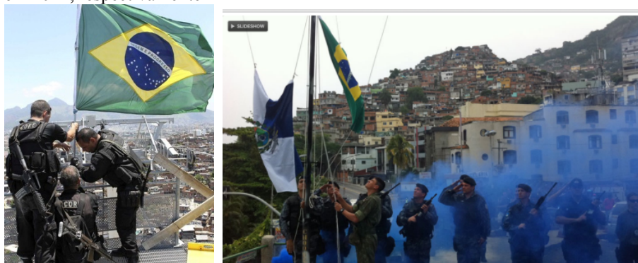
Figura 3 – Policiais no Complexo do Alemão, em 2010, e no Morro do Vidigal, em 2011, respectivamente