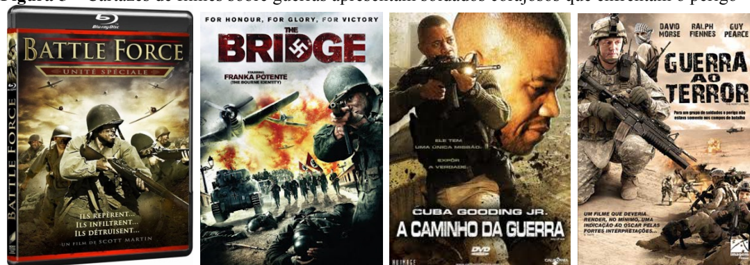
Figura 5 – Cartazes de filmes sobre guerras apresentam soldados corajosos que enfrentam o perigo

levar à sensação de normalidade, mesmo num momento de ocupação e presença policial no cotidiano da comunidade.