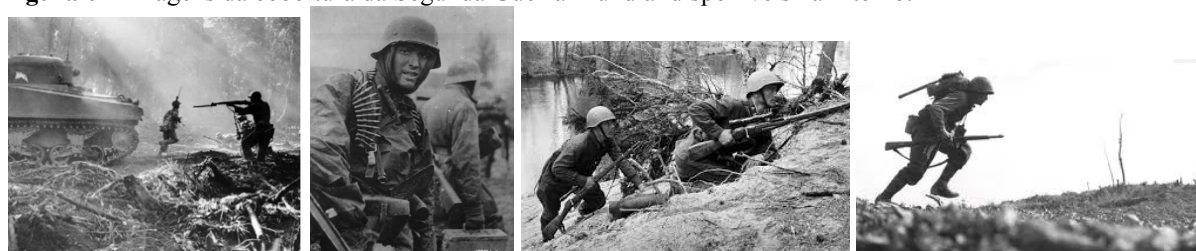
Figura 6 – Imagens da cobertura da Segunda Guerra Mundial disponíveis na Internet