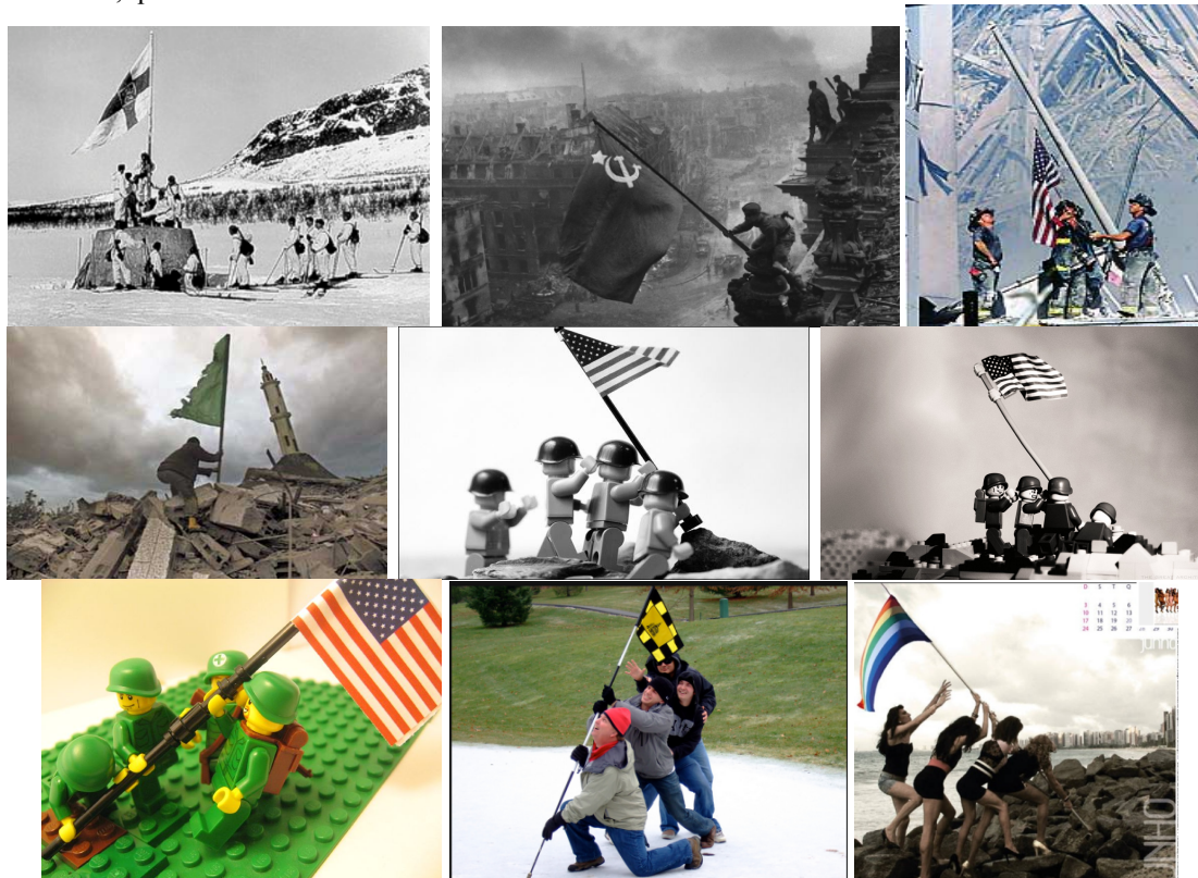
Figura 4 – Da esq. para dir: tropas finlandesas após fim da guerra da Lapônia em abril de 1945; bandeira da vitória soviética no parlamento alemão em Berlim em maio de 1945; bombeiros em Nova Iorque nos escombros do atentado em setembro de 2011; palestino coloca bandeira do Hamas em escombros ao lado de uma mesquita em Gaza em janeiro de 2009; três diferentes montagens da cena de Iwo Jima com lego; foto pessoal no Flickr repetindo a cena; página de calendário produzido pelo grupo teatral “As travestidas”, do Ceará, que faz referência a obras famosas