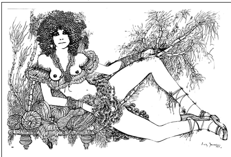
Painel de autoria de Luiz Jasmim 13

vegetal, é possível pensar os deslocamentos de papéis que se queiram fixos 14 , como a ideia de mulher pela visão conservadora-tradicional.