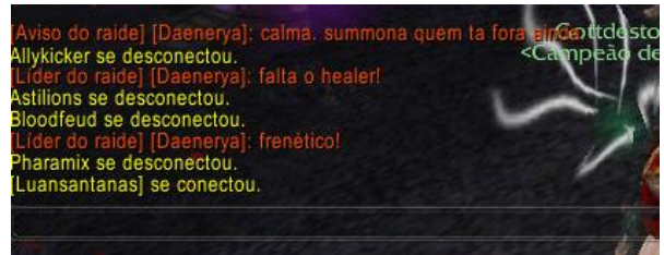
Figura 1: Exemplo de liderança em raid.

As posições sociais dentro do jogo não são estáticas, ao contrário, são dinâmicas e podem mudar o tempo todo, porém nunca deixam de existir, segundo o pensamento de Bourdieu [2013], sobre posições de um indivíduo dentro de uma estrutura social, onde ele coloca que o indivíduo não pode sofrer uma classificação estática de uma posição relativa, e sim, que sua trajetória seja levada em consideração. Ao aplicarmos esse pensamento dentro jogo podemos definir que um jogador começa sua jornada numa posição considerada baixa pelo resto do grupo, o denominado “noob”, com o decorrer do tempo, ao adquirir experiência, ele também adquire o respeito e confiança da comunidade para ocupar posições mais altas de liderança, mesmo que sejam passageiras, visto que o jogo possui uma dinâmica que permite postos de liderança efêmeros que podem durar apenas uma determinada partida.