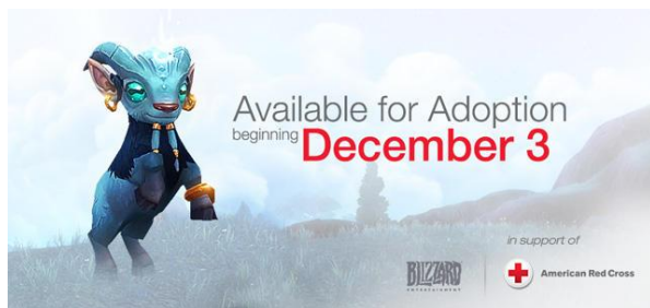
Figura 3: Mascote vendido pela Blizzard para arrecadar fundos para a Cruz Vermelha.

Não é só dentro do ambiente de jogo que os adeptos de World of Warcraft se unem em prol de causas. Em Novembro de 2014, o site Gamespot noticiou que a empresa Blizzard criara um mascote (pequenos animais com função puramente estética que acompanham o jogador), que podia ser adquirido em sua loja online por dez dólares, e a totalidade da renda seria revertida para os programas de combate ao ebola da Cruz Vermelha. Ao fim da campanha, em Fevereiro de 2015, o site PCGamer, trouxe a público o montante em dinheiro revertido para a Cruz Vermelha com as vendas do mascote: 1,9 milhões de dólares. Em 2011, a empresa havia arrecadado quantia semelhante em uma mesma ação para os esforços humanitários no Japão após o terremoto e tsunami que devastou parte do país.