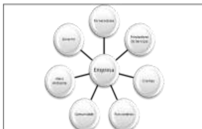
Figura 1 - Stakeholders

Korporativ Sosial Məsuliyyət (KSM) ideyası hüquqi məsuliyyət ideyası, bir səbəb ilə sosial etik mənada məsul davranış, və ya könüllü töhfə fikir və birləşmək kimi ilə bağlı olan, qəbul olunacaq müxtəlif davranışları təşkilatın müşahidə oluna bilər Borger (2001, p. 15), buna görə də, sosial məsuliyyət hər bir şirkət daxil olan sosial-mədəni kontekstində görə biraz müxtəlif tələbləri ola bilər şirkətlər tərəfindən qarşılanaq üçün problemlər geniş dəsti kimi görünür.