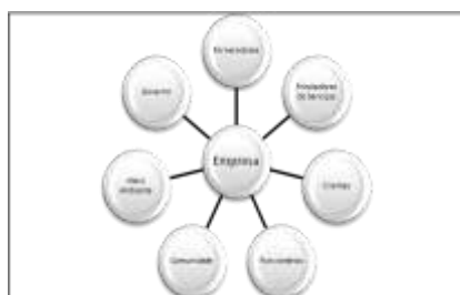
Figura 1 - Stakeholders

Korporativ Sosial Məsuliyyət (KSM) ideyası hüquqi məsuliyyət ideyası, bir səbəb ilə sosial etik mənada məsul davranış, və ya könüllü töhfə fikir və birləşmək kimi ilə bağlı olan, qəbul olunacaq müxtəlif davranışları təşkilatın müşahidə oluna bilər Borger (2001, p. 15) , buna görə də, sosial məsuliyyət hər bir şirkət daxil olan sosial-mədəni kontekstində görə biraz müxtəlif tələbləri ola bilər şirkətlər tərəfindən qarşılanaq üçün problemlər geniş dəsti kimi görünür.