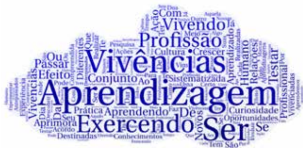
Figura 2 - Como você compreende o conceito de experiências?