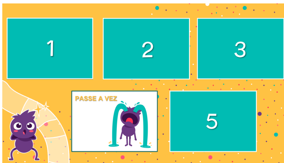
Figura 3: Cartas do jogo aplicado

Um dos jogos (figura 3, 4) elaborado, foi constituído por cartas-perguntas e cartas-surpresas numeradas. No início da partida, os jogadores foram divididos em dois grupos. Posteriormente, os participantes de um dos grupos escolhiam um número para executar o comando da carta. Dessa forma, ao escolher uma numeração, os jogadores poderiam ter que responder uma pergunta relacionada ao conteúdo e caso acertassem a questão, ganhariam pontos conforme a atribuição de cada uma das cartas. Porém, o número escolhido poderia também corresponder a uma das cartas-surpresas, contendo ações do tipo “passe a vez”, “você ganhou vinte pontos”, “você perdeu tudo” ou “fique uma rodada sem jogar”. O grupo que acumulou a maior pontuação foi o vencedor.