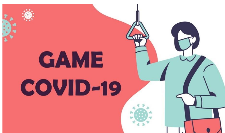
Figura 2: Quiz aplicado referente à COVID-19