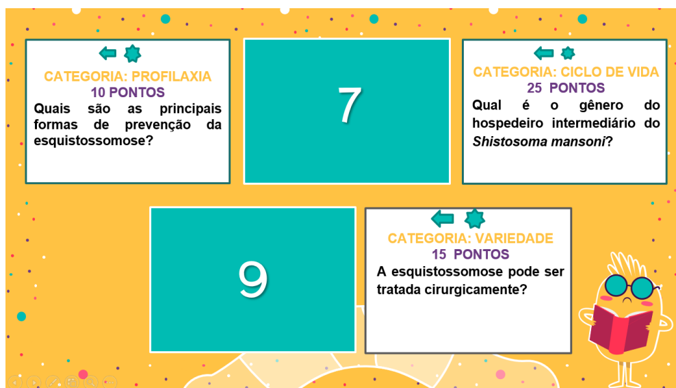
Figura 4: Cartas do jogo aplicado