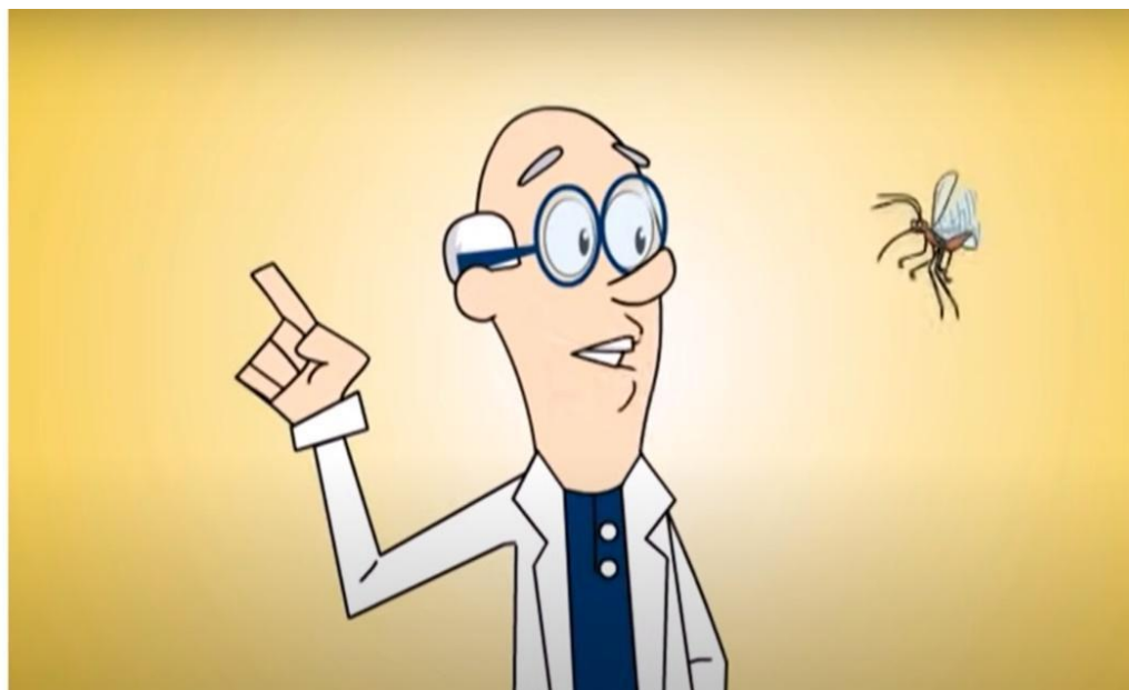
Figura 7: Recurso audiovisual utilizado

Em alguns encontros foram disponibilizados também vídeos educativos (figura 7) abordando conteúdos como, por exemplo, o ciclo de vida entre outros aspectos do assunto que seria abordado.