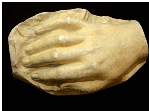
Figura 1 14 – As mãos engessadas de Mistral 15