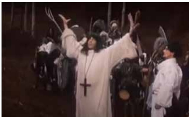
Figura 4 – O padre e os peregrinos

Fonte: Cena do filme O incrível exército de Brancaleone , min.39:03.