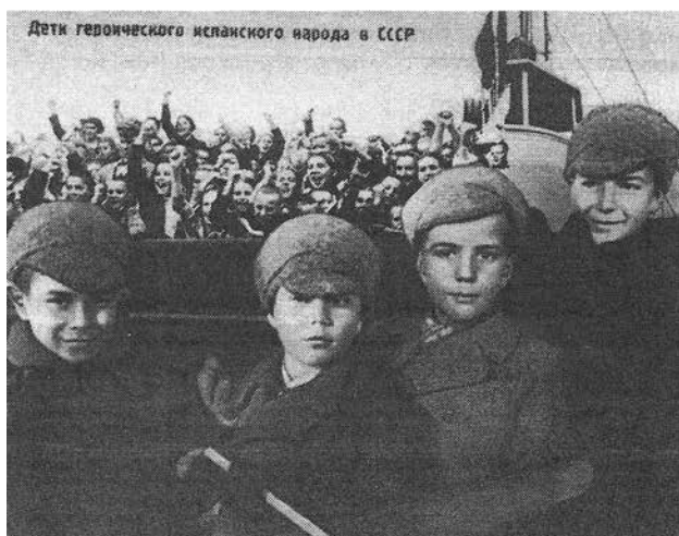
Figura 7 - Grupo de niños y niñas españoles a su llegada al Puerto de Kronstadt (Leningrado) retratados en la cubierta del barco Kooperatsia por la prensa soviética.

Fuente: Cfr. CIMORRA, Eusebio; MENDIETA, Isidro R.; ZAFRA, Enrique. El sol sale de noche. La presencia española en la Gran Guerra Patria del pueblo soviético contra el nazi-fascismo. Moscú: Progreso, 1970, p. 71.