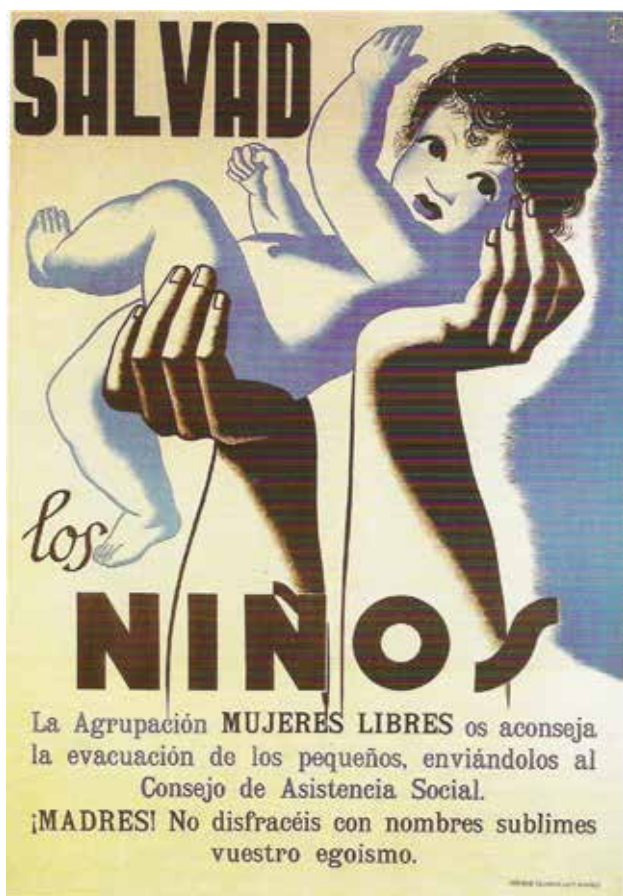
Figura 1 - Cartel de la agrupación anarquista Mujeres Libres instando a la evacuación infantil impreso en Madrid en Gráficas Reunidas durante los primeros meses de la Guerra Civil.