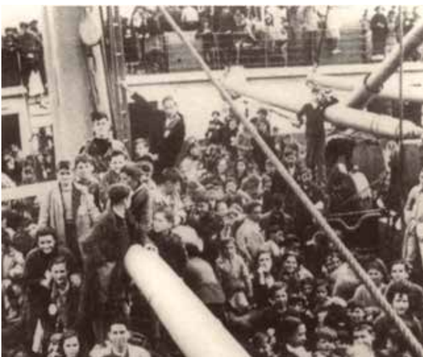
Figura 3. Niños y niñas españoles en la cubierta del barco Habana . Bilbao, 1937.