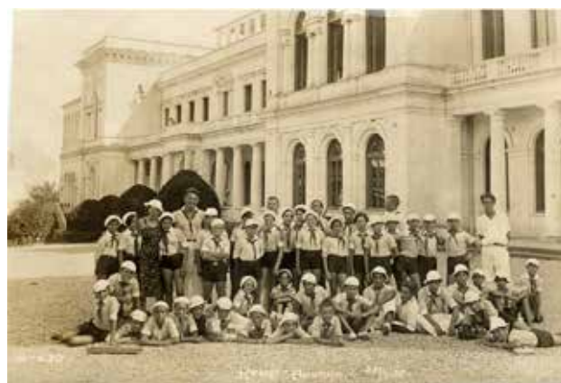
Figura 4. Grupo de niños y niñas españoles con sus maestros y maestras en un Sanatorio del Mar Negro, sin fecha.