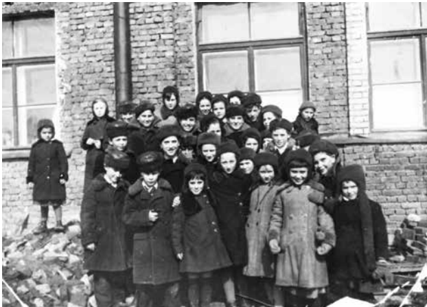
Figura 5. Un grupo de niños y niñas españoles en la “Casa de Niños” n.º 9 de Leningrado, 1937.