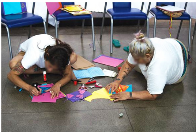
Figura 7 – Imagens do Escambo poético dentro e fora da Penitenciária (2019)

siderando mais do que a sua dimensão textual. A proposta é comunicar afetos a partir das sensações daquele objeto produzido manualmente. Desse modo, são utilizados papéis de cores e texturas diversas, pedaços de tecido, lápis coloridos etc., o que também possibilita envolver mulheres que têm dificuldade com a escrita de se expressar e apropriar-se daquela construção narrativa pessoal. Nos encontros do “Escambo poético”, são discutidos textos poéticos e políticos que se relacionam com a situação do corpo feminino no cárcere.