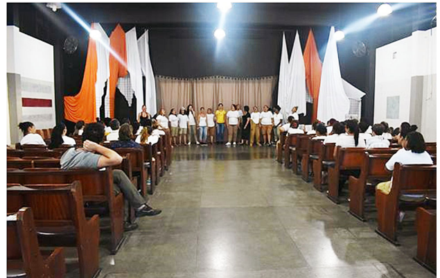
Figura 2 – Fotos de apresentação do Lab_Performance na PFC

uma modalidade do fazer pedagógico em que o território de construção e reconstrução do conhecimento se conforma mediante a criação de um espaço de trocas que se pretendem o mais horizontais possíveis. Pode-se lançar mão de inúmeros recursos disparadores dessas trocas como músicas, textos, observações diretas, pesquisas de campo, práticas corporais etc. e a mobilização de cada participante afeta diretamente todo o plano coletivo. O desígnio das ações é sempre a complementaridade, nunca a competitividade. A partilha – momento de falar e mostrar – funciona como um aglutinante que conecta as partes e faz ver os pontos de amarração entre elas. É, também, próprio desse formato a materialização das produções ao final das atividades, aspecto que, no contexto dos Lab_, gerou mostras abertas e exposições internas e externas à unidade prisional em diversos formatos.