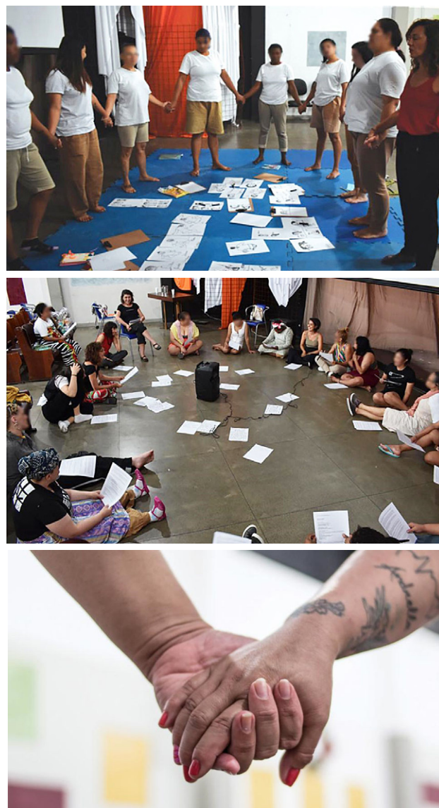
Figura 1 – Fotos dos Laboratórios de criação realizados na PFC