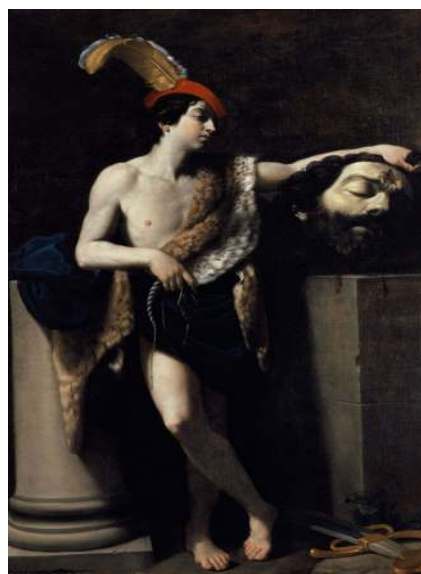
Figura 3. David com a cabeça de Golias (1606), de Guido Reni.