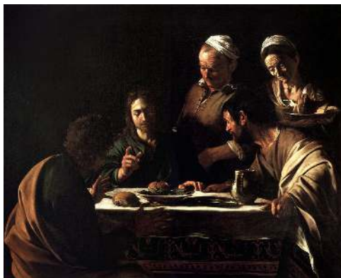
Figura 2. Ceia em Emaús (1606), de Caravaggio.