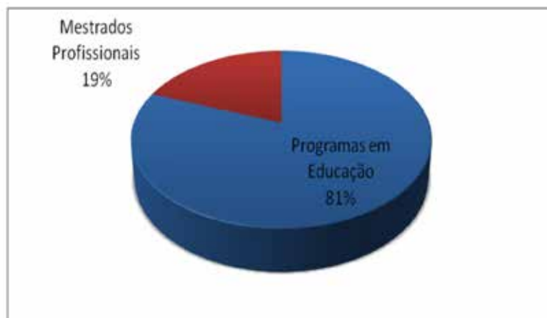
Gráfico 01 – Programas de Pós-Graduação da Área de Educação

Hoje, 2016, temos aproximadamente 160 Programas de Pós-Graduação na Área da Educação, sendo que 38 são Mestrados Profissionais, os quais representam 19% de todos os Programas da Área reconhecidos e recomendados 2 pela CAPES em todo o Brasil.