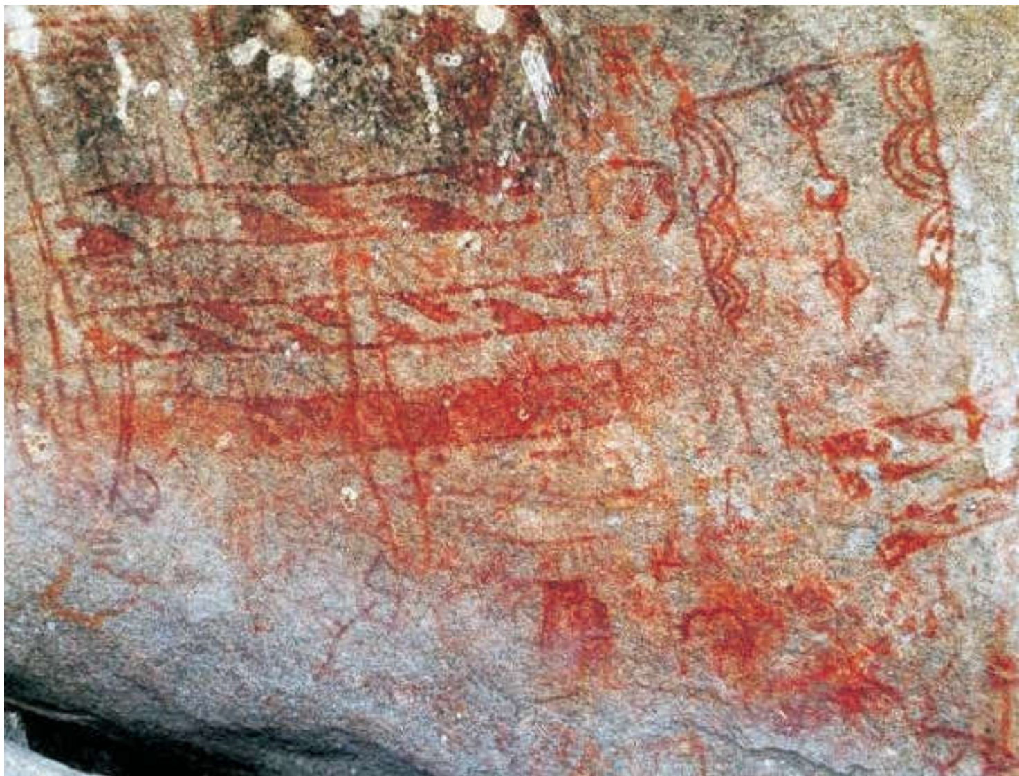
▲ Figura 3: Pintura Rupestre do Complexo Arqueológico de Paulo Afonso (CAAPA, 2007).