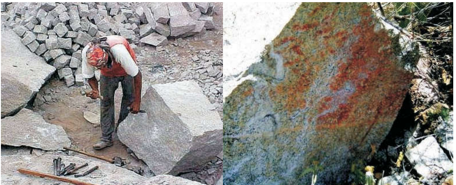
Figura 1: Sítios Rupestres destruídos em Paulo Afonso (CAAPA, 2007).