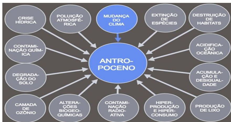
Figura 1 - O que você faria se soubesse o que eu sei?: O colapso (in)evitável e o Antropoceno

Este é, sinteticamente, o conhecimento atual sobre os efeitos das mudanças climáticas sobre a natureza, o homem, e as comunidades sociais. A compreensão teórica para tudo isso que assenta no produto da elevação da concentração dos gases efeito de estufa, sendo o homem o grande responsável por essa elevação e por um conseqüente potencial desarranjo ambiental a tal nível que ameaça a sua própria sobrevivência, demorou até ser aceite, e a certeza factual demoraria ainda mais a consolidar-se.