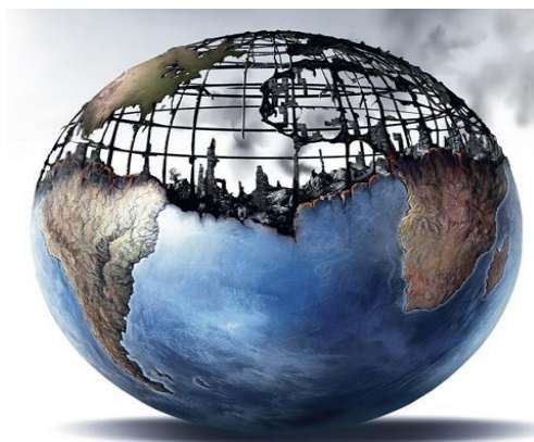
Figura 2 , in Bertolami (2018b), Forumdemos, dezembro, 1, Utopia Ecológica, Utopias Europeias. ( https://forumdemosnet.wordpress.com/2018/12/01/a-humanidade-no-antropoceno/ ).

No entanto, à medida que o oceano aquece, ele perde capacidade de absorver gás carbónico, o que pode acelerar os efeitos atmosféricos quando atingir a saturação. Os oceanos continuarão a acidificar-se e aquecer ao longo do século XXI e mesmo para além; o nível do mar aumentou em cerca de 19 cm entre 1901 e 2010 devido ao aumento térmico das águas; a elevação pode chegar a mais de 80 cm até 2100; sendo certo que o nível do mar vai continuar a subir depois de 2100; haverá impactos significativos sobre a natureza e a sociedade.