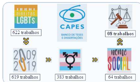
Figura 1: Pesquisa de trabalhos na Plataforma CAPES sobre nome social

Nas buscas (ver Figura 1), utilizei o seguinte descritor: “direitos LGBT”. Foram encontrados 622 trabalhos. Fazendo o recorte temporal, trabalhos publicados no período entre 2009 e 2019, para se pensar em uma década de produção após o primeiro provimento jurídico sobre nome social (datado de 02 de janeiro de 2009), resultaram 619 pesquisas. Dessas 619 pesquisas, selecionei as que envolviam a temática de travestis e transexuais, encontrando 191 trabalhos sobre travestilidades e 192 trabalhos sobre transexualidades. Refinando a pesquisa para a temática “nome social”, observei entre os trabalhos sobre pessoas trans (383), que citavam o referido tema, encontrando 64 pesquisas.