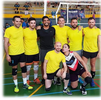
Legenda: Clube Alfar Voleibol — Valencia/Espanha. Disponível em: http://voleibol.asociaciones.alfar.es/quienes-somos/ .

Então assim, eu hoje vou completar 40 anos (no próximo mês dia 13), estou no Brasil há oito meses por conta da pandemia, muita coisa atrasou, muita coisa deixou de ser concluída, o meu último campeonato lá foi parado justamente no ano passado, no dia da mulher (no dia 7 a gente fez o último jogo). Eu joguei em Valência, em um clube da cidade, então eu voltei para o Brasil e estou aqui há oito meses. O que está acontecendo comigo agora no momento? Estou jogando pelo clube da minha cidade, que eu vou realizar o primeiro campeonato oficial representando a minha cidade aqui no Ceará, que é um marco, 40 anos e eu no auge, estou muito bem graças a Deus, fisicamente tudo tá muito bem, estou treinando 5 dias da semana sem parar, são 3 horas de