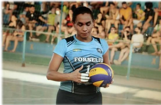
Legenda: Foto do arquivo pessoal @jessicapalavollo.

Jéssica: Meu sobrinho é o técnico da escolinha de vôleibol e o projeto tem mais de 200 atletas, inclusive a gente está em competição agora, o campeonato cearense na categoria de base, desde o infante, o infantojuvenil e o adulto. E a gente abriu essa semana as inscrições para formar a escolinha mesmo, com treinamentos, com mais responsabilidades, é tanto que a inscrição não são os atletas que podem ir fazer, tem que ir com os pais. Só que a gente tem pouco apoio, aquela coisa, né?! Só é reconhecido depois do sucesso, é tanto que tive que trazer material, 2017 tive que trazer um material da Europa, por conta de que lá sai mais barato, a própria bola micasa, rede. E aí a gente faz uma parceria, quando posso trago bolas, apito, uniforme, essas coisas que é pra engajar no projeto e as pessoas sentirem mais valorizadas. E por incrível que parece a gente tem bastante gays também no projeto, eles se sentem em casa, o vôleibol tem aquela coisa, é um esporte que abraça mais esse público, dá mais oportunidade e a gente se sente bem à vontade, bem em casa. Creio que sim, vai sair muito atleta bom daqui futuramente, a gente tem uma bagagem muito boa aqui, porque tem o talento individual de cada um. E eu vou te passando as novidades daqui, quando forem surgindo.