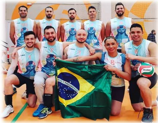
Legenda: Clube Alfafar.