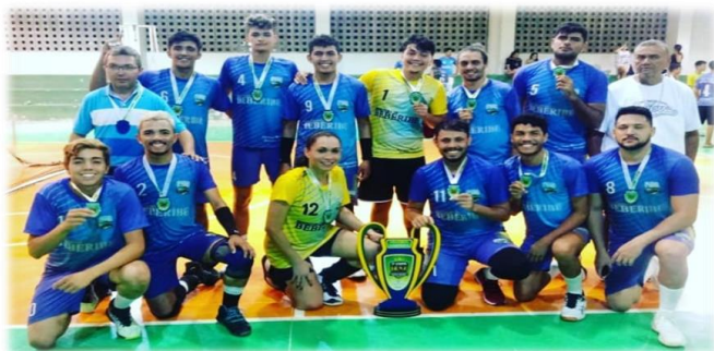
Legenda: Equipe masculina do Projeto de Voleibol Beberibe — PVB. Campeãs da I Copa Raimundo Francisco Freitas Jaguaribe, Jaguaruana-Ce 2020.

da tem que explicar”. Você vê que a violência no nosso país, na maioria das vezes, não é gerada porque estou com minha família ou com meus amigos em um restaurante, ou estou em um ambiente favorável a qualquer pessoa, seja trans ou hetero, mas as pessoas às vezes gostam muito de querer aparecer de uma forma negativa. Eu busquei o esporte graças a deus, o esporte me abriu portas e acho que qualquer outra coisa seria bem complicado, bem difícil. E vai muito também da educação, aceitação, respeito. Quando você se encaixa em alguma coisa que te faz bem, no meu caso o vôleibol, me evitou muitos preconceitos fortes, me evitou muitas intrigas, muitas confusões. Porque uma pessoa pra falar hoje na cidade de Jéssica, ela infelizmente tem que engolir assim à seco, “ai não mas joga, ai mas tem talento”. A gente vai ter que respeitar mesmo que não queiram, mesmo que não gostem, porque a gente percebe, “ai chegou o viado, ai é o viado que vai pegar minha vaga? Não vai!” e isso é muito difícil, a gente tem que pensar também no outro lado, o hetero tá jogando e vou e tomo o lugar dele.