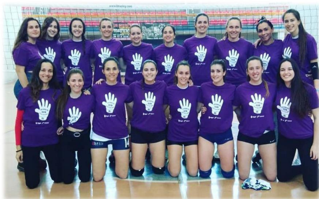
Legenda: Foto publicada no Dia da Mulher, 8 de março de 2020. Equipe Feminina Sedavi.

treinamento, é bem puxado, mas, mesmo assim, eu ainda me encaixo com o masculino. Eu treino com o feminino 1:30h e depois sigo 1:30h com os meninos, porque ainda não saiu da minha cabeça o voleibol masculino, eu jogo na posição de líbero e sinto mais prazer jogando no masculino, porque é mais forte e mais pesado. Realização? No feminino! Prazer? no masculino!