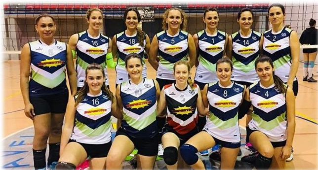
Legenda: Equipe Feminina Sedavi, Valência/Espanha 2018.