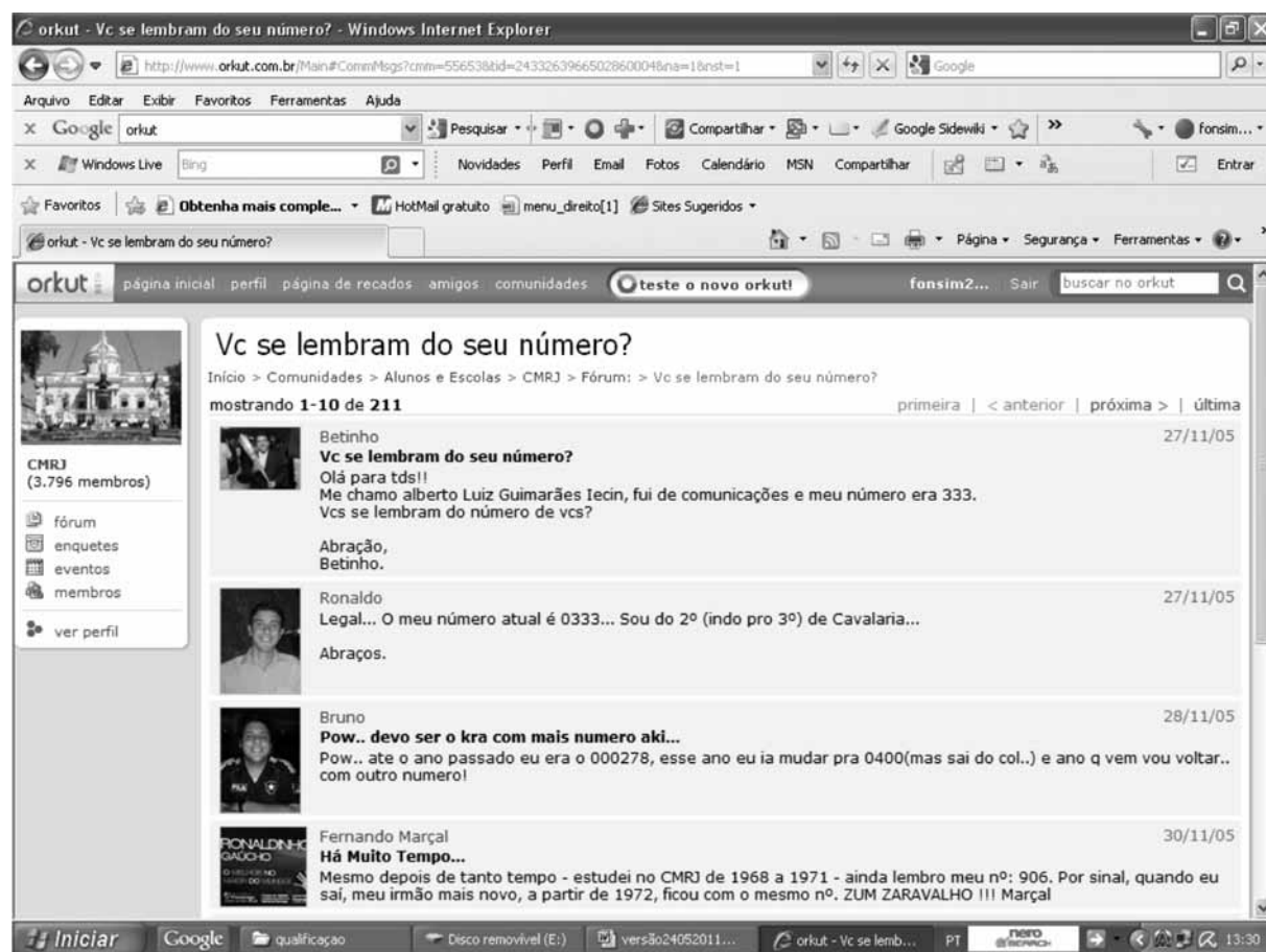
Figura 3 – Página da Comunidade do Colégio Militar do Rio de Janeiro no Orkut – Fórum Vc se lembram do seu número?