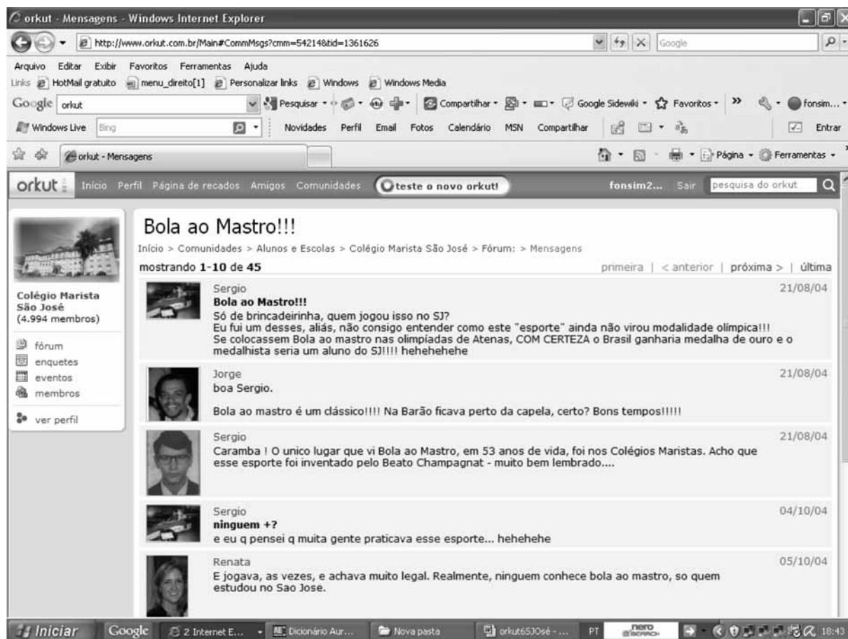
Figura 2 – Página da Comunidade do Colégio Marista São José do Rio de Janeiro no Orkut – Fórum Bola ao Mastro

A Figura 2 pode exemplificar possíveis compreensões nas histórias de escola dos ex-alunos na comunidade do Colégio Marista São José do Rio de Janeiro.