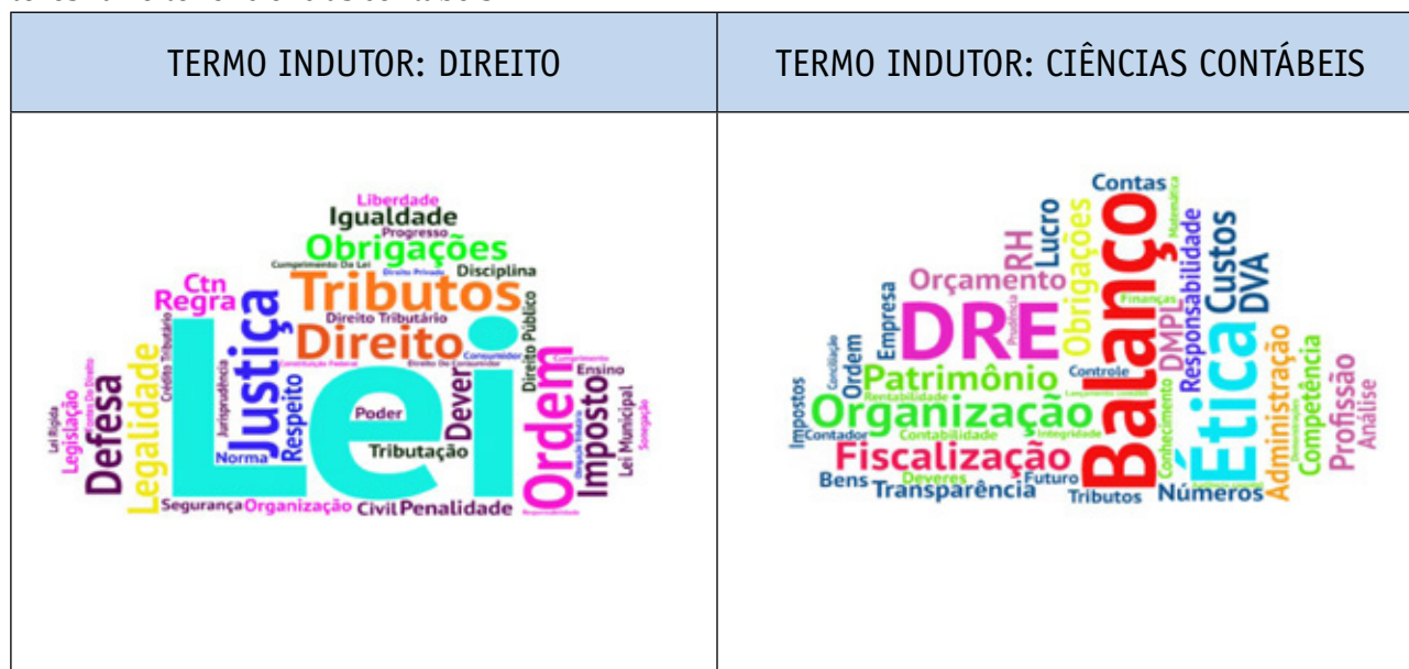
Figura 3 – Nuvens lexicais produzidas pelo Programa Tagul a partir das evocações para os termos indutores “direito” e “ciências contábeis”