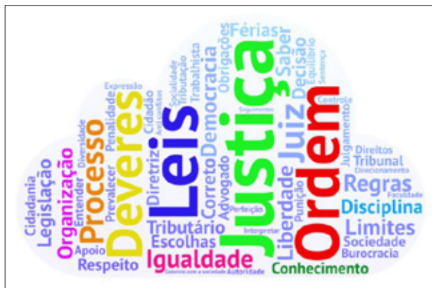
Figura 2 – Nuvem lexical produzida pelo Programa Tagul a partir das evocações para o termo indutor “direito”