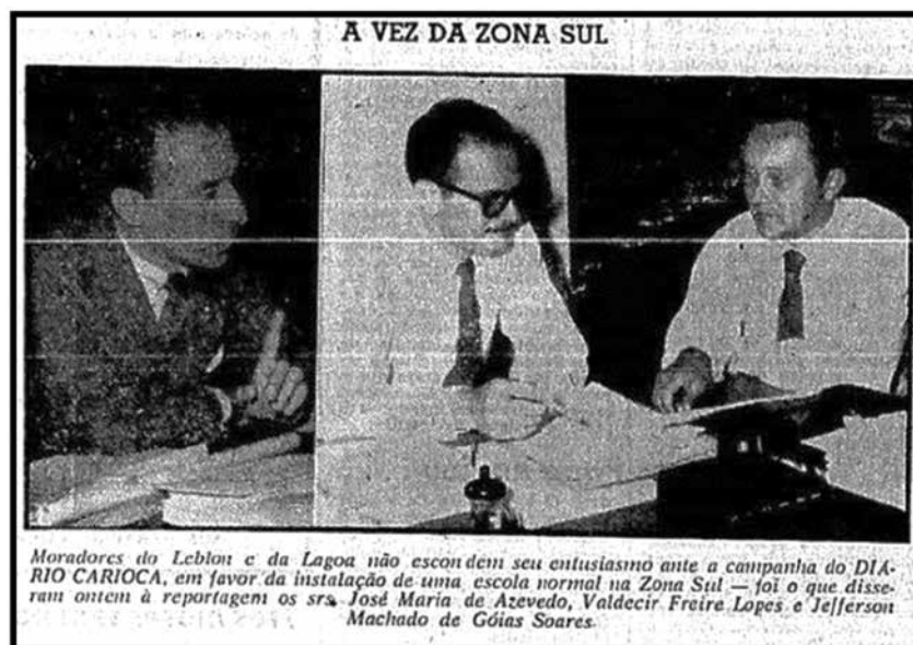
Figura 3 – Foto da reportagem “Leblon e Lagoa pedem Escola Normal da ZS”, do Diário Carioca de 24 de abril de 1959