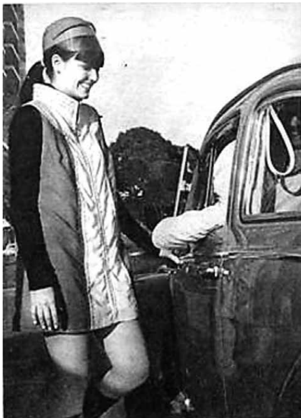
Figura 6 – Foto interna da revista O Cruzeiro mostrando professora normalista trabalhando como frentista