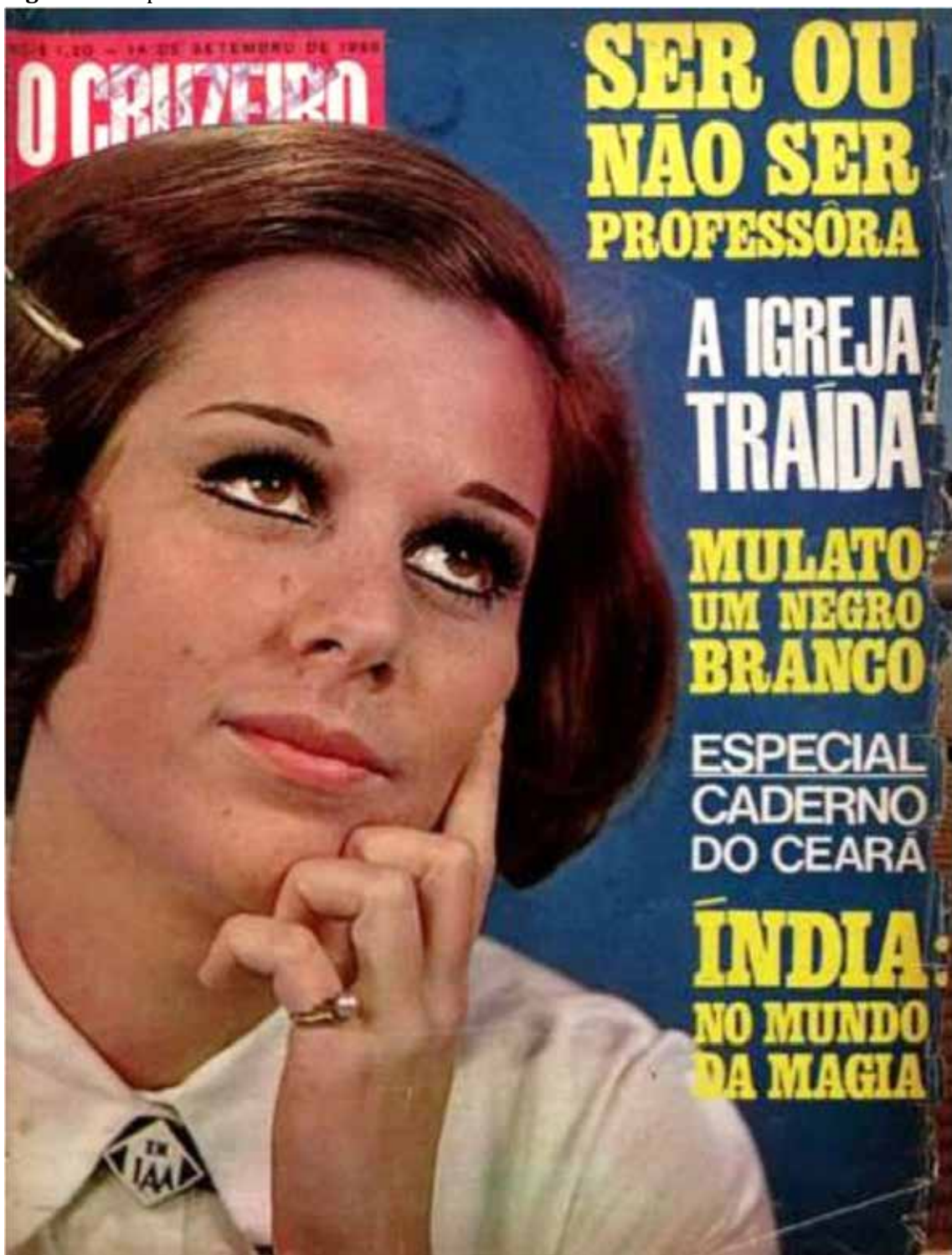
Figura 5 – Capa da revista O Cruzeiro de 14 de setembro de 1968