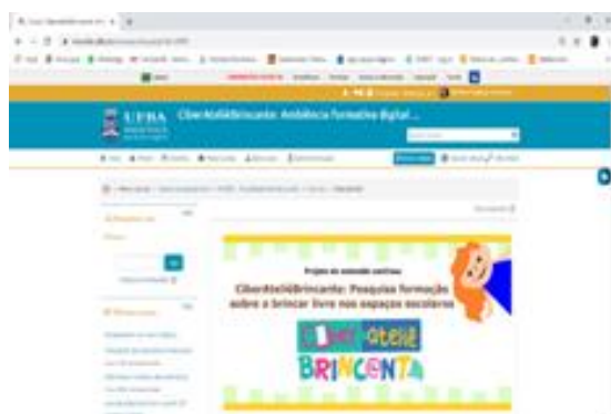
Figura 1 - Interface: Ambiente Moodle UFBA.

Assim, para este projeto, conforme Figuras 1 e 2, desenhamos outros etnométodos, utilizando as interfaces criadas nos ambientes virtuais de