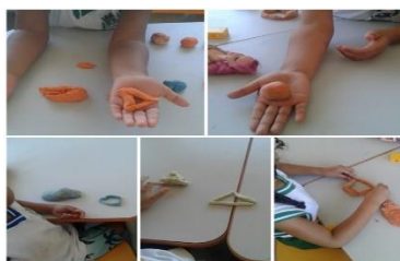
Figura 2 - Registros do 2º dia (atividade com massinha)

Apresentamos as crianças uma música autoral que foi cantada ao vivo, e as crianças iam nos acompanhando com as palmas e reproduzindo os gestos que fazíamos. Posteriormente, tivemos o momento da atividade lúdica do dia, onde cada criança organizada em dupla, recebeu uma massinha de modelar colorida para que pudesse fazer representações das formas geométricas que estão aprendendo (Figura 2).