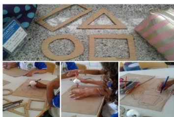
Figura 4 – Atividade com formas vazadas

colorir, e o resultado foi muito surpreendente, pois conseguimos observar que em poucas semanas as crianças já conseguiam ter um domínio motor melhor.