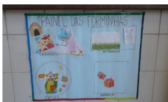
Figura 3 – Painel das Forminhas

Com a ajuda das educadoras da sala, elas fizeram o recorte e colagem em um painel de cartolina que foi fixado na sala. O painel foi dividido em quatro partes (Figura 3), cada uma correspondendo a uma forma geométrica, e de acordo com a figura recortada, as crianças foram colando suas figuras dentro do espaço correto. Após este momento, as crianças receberam folhas em branco, para que fizessem desenhos que continham as formas geométricas.