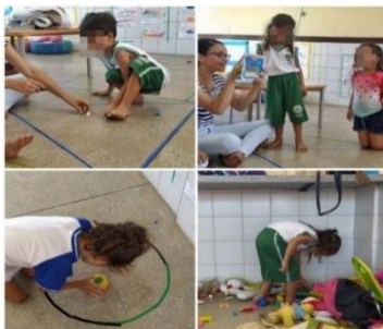
Figura 1: Registros do 1º dia (As crianças buscando nos brinquedos as formas geométricas