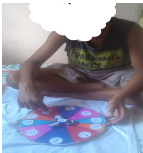
Figura 4. Aluno apresentando o jogo.