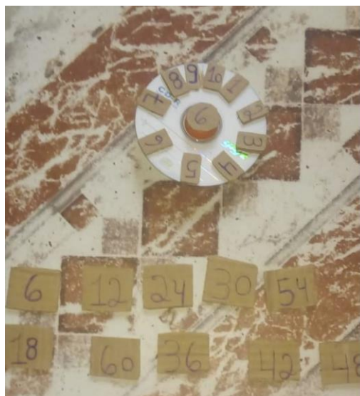
Figura 2. Jogo confeccionado pelo Grupo.

Um dos momentos mais importantes dessa experiência foi a socialização. Em cada grupo os alunos faziam vídeo chamadas pelo whatsapp e socializavam o funcionamento do jogo. Como em geral era um jogo simples de ser confeccionado, cada aluno tinha o seu e jogava, tal momento foi muito importante, mas foi necessário que todos os grupos pudessem ver o jogo de cada um. A professora orientadora tomou o cuidado para que um mesmo jogo estivesse presente em mais de duas equipes. O intuito era diversificar a gama de jogos didáticos para melhor opção de estudo dos alunos.