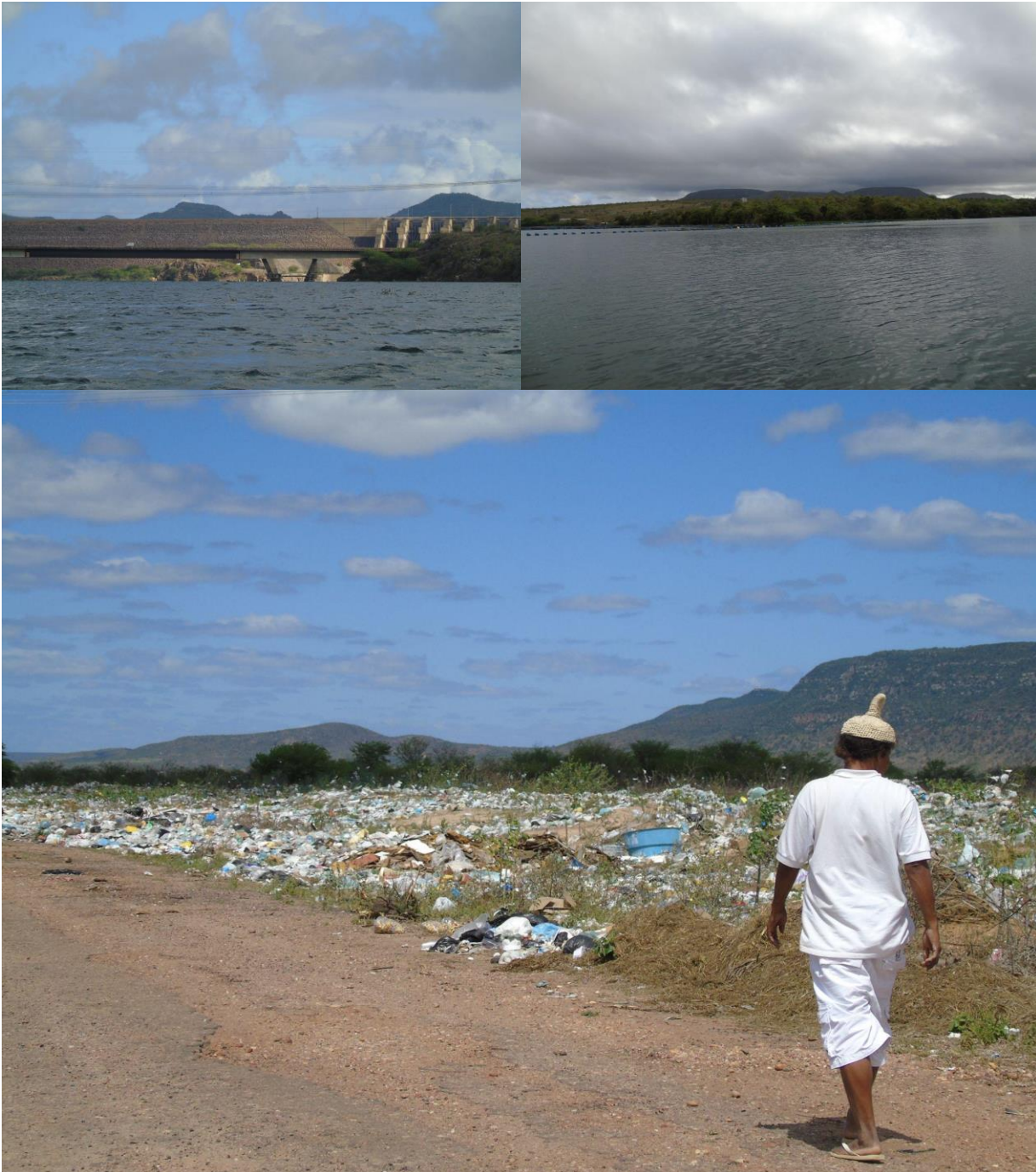
Figura 6: Território Pankararu Opará sendo reivindicado junto ao governo Federal à ser demarcado, áreas de conflitos com a Chesf, Lixões da Prefeitura de Jatobá e produção de tilapia em áreas de captação de água de beber