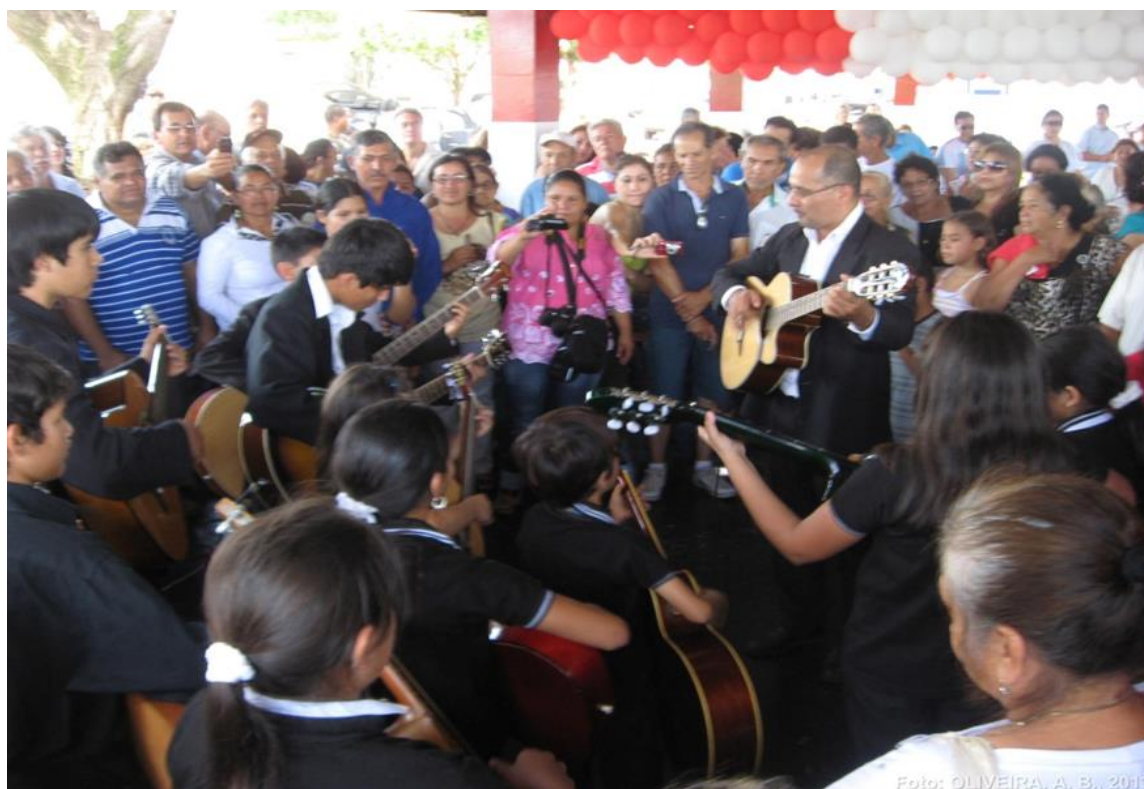
Foto 04 – O mesmo local sendo ocupado por diferentes territorialidades