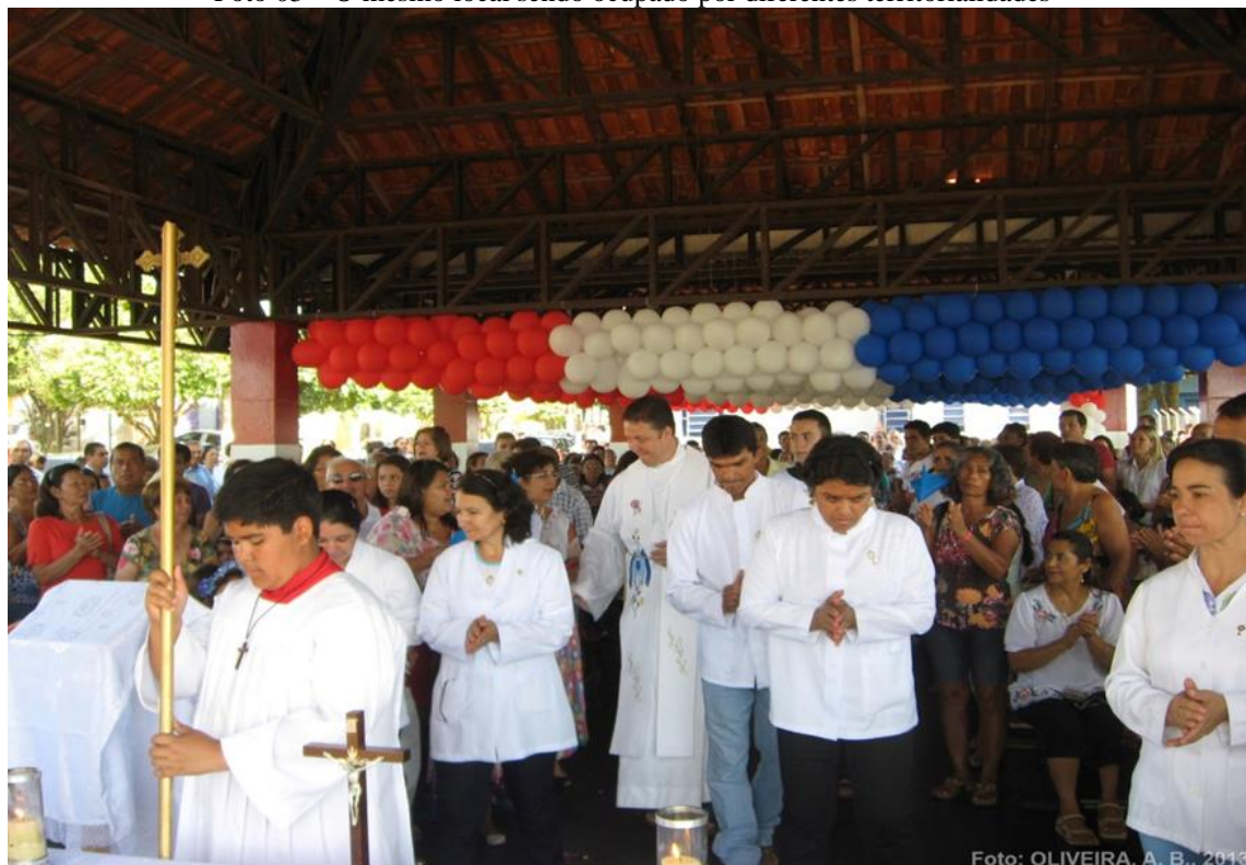
Foto 03 – O mesmo local sendo ocupado por diferentes territorialidades