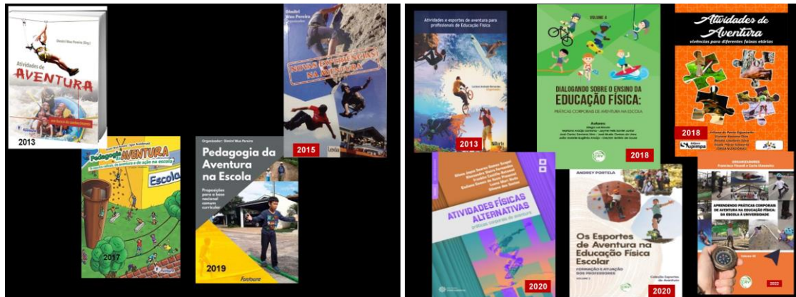
Figura 3 – Ejemplos de portadas de libros sobre actividades de aventura de los años 2010-2020