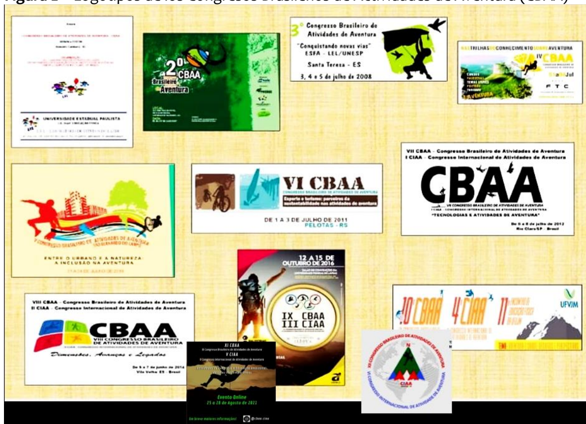
Figura 2 – Logotipos de los Congresos Brasileños de Actividades de Aventura (CBAA)