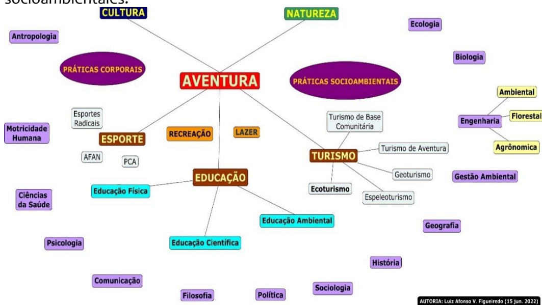
Mapa conceptual 1 – La aventura y sus relaciones entre prácticas corporales y prácticas socioambientales.

Propongo entonces pensar la AVENTURA entre la idea de cultura y naturaleza, entre las prácticas corporales y las prácticas socioambientales. (Mapa Conceptual 1).