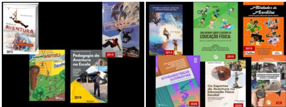
Figura 3 – Ejemplos de portadas de libros sobre actividades de aventura de los años 2010-2020