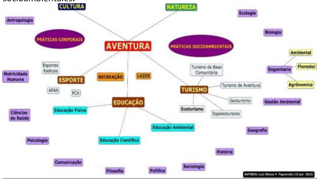
Mapa conceptual 1 – La aventura y sus relaciones entre prácticas corporales y prácticas socioambientales.

Propongo entonces pensar la AVENTURA entre la idea de cultura y naturaleza, entre las prácticas corporales y las prácticas socioambientales. (Mapa Conceptual 1).