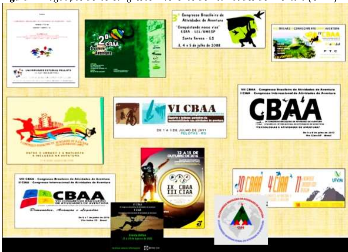
Figura 2 – Logotipos de los Congresos Brasileños de Actividades de Aventura (CBAA)