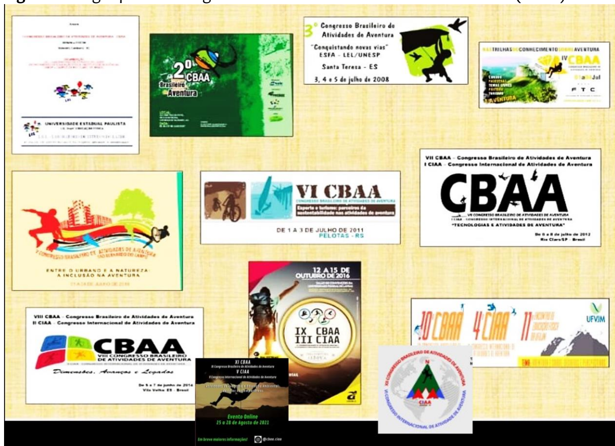
Figura 2 – Logotipos dos Congressos Brasileiros de Atividades de Aventura (CBAA)