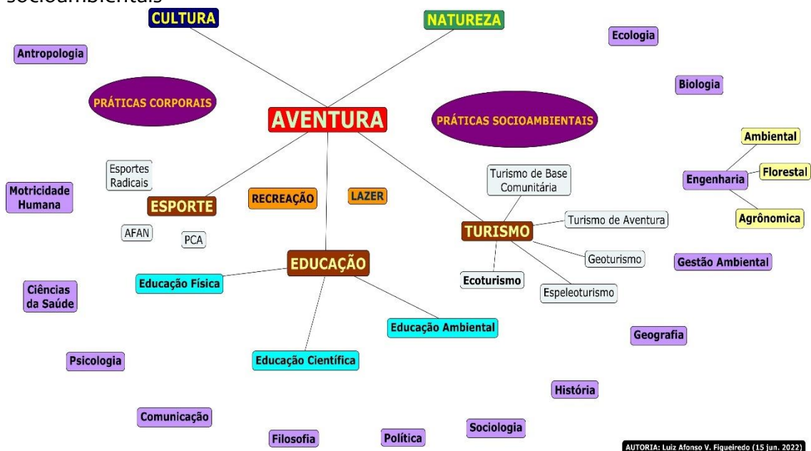
Mapa conceitual 1 – A aventura e suas relações entre práticas corporais e práticas socioambientais

AUTORIA: Luiz Afonso V. Figueiredo (15 Jun. 2022)