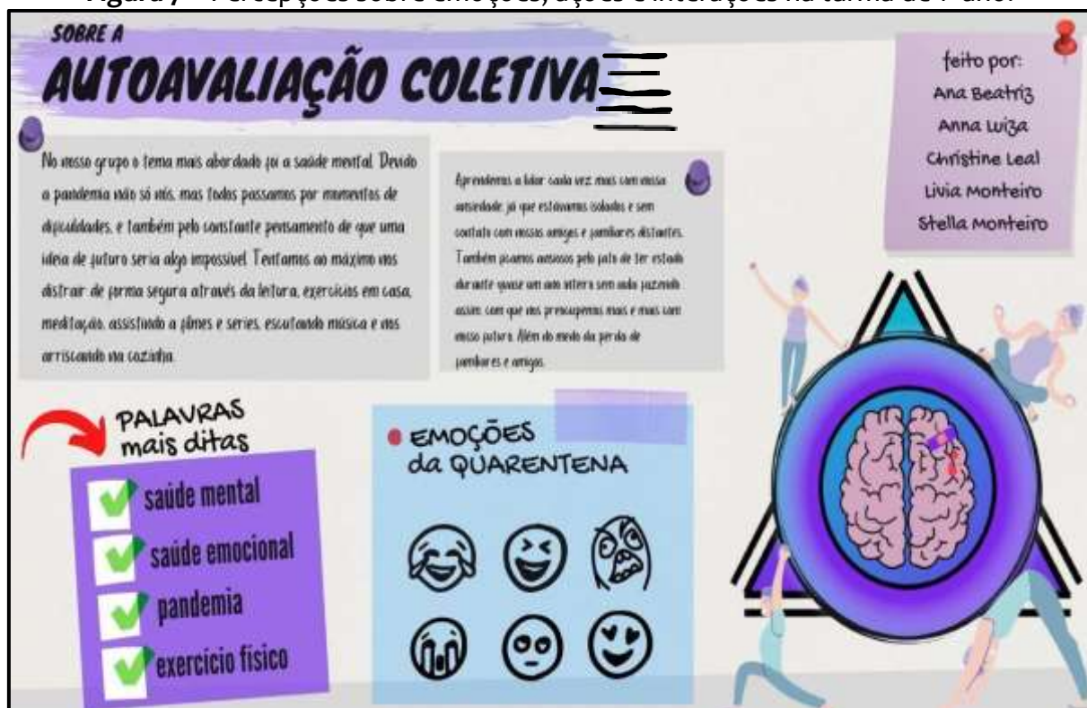
Figura 7 – Percepções sobre emoções, ações e interações na turma de 1º ano.

Seguindo essa lógica de compartilhar saberes e experiências, foi estimulado que os discentes, por meio de uma linguagem de posts de rede social, construísem uma autoavaliação coletiva para compartilhar com a turma sobre como aspectos da saúde emocional se traduziam no corpo. A construção avaliativa representada pela Figura 7 foi proposta por um grupo de alunos de uma turma de 1º ano e resumiu as percepções sobre emoções, ações e interações dos discentes da classe: