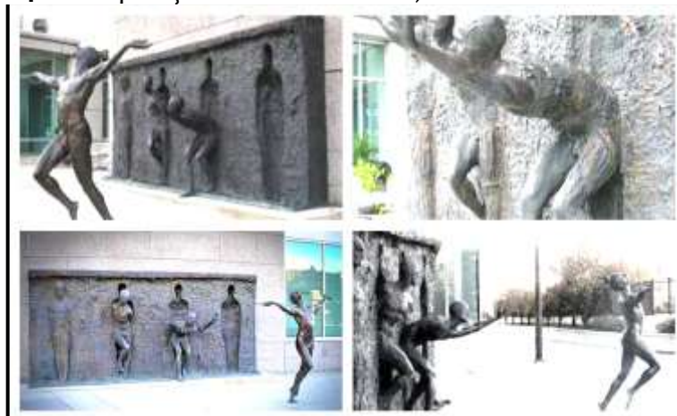
Figura 4 – Composição da obra Libertad , do escultor Zenós Frudakis.