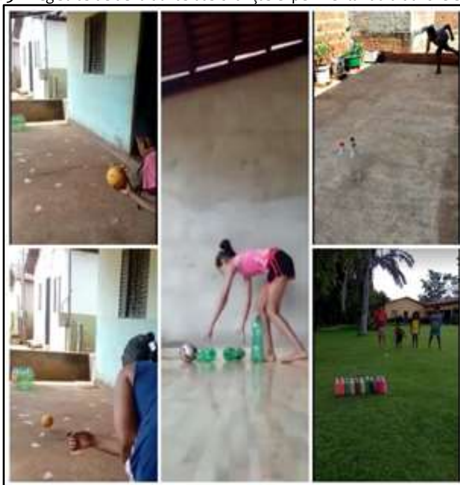
Figura 3 – Registros de devolutivas das crianças experimentando o boliche em casa.

[...] Fomos aperfeiçoando os roteiros de estudos para que, cada vez mais, pudéssemos atribuir aos nossos alunos conhecimentos significativos. [...] Buscamos formas para adaptarmos a linguagem da escrita [...], passamos a colocar frases convidativas [...]. Diante das adaptações para melhor mediar o conhecimento [...] percebemos avanços [...] com os alunos, pois os mesmos passaram a fazer a devolução dos roteiros [...] e começaram a produzir os vídeos realizando as atividades práticas [...] (NARRATIVA, bolsista Pibid/EF/UFT).