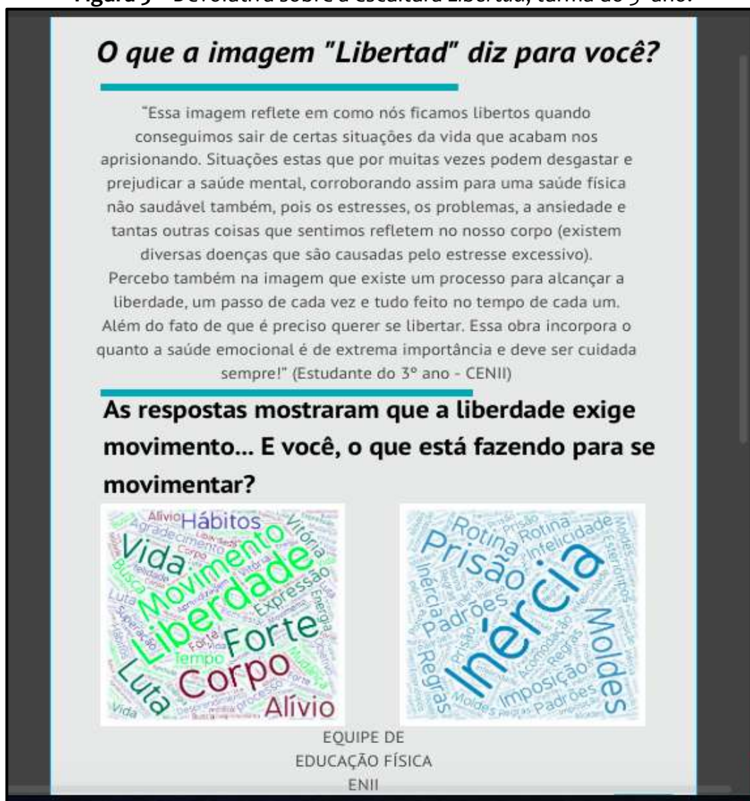
Figura 5 – Devolutiva sobre a escultura Libertad , turma do 3º ano.