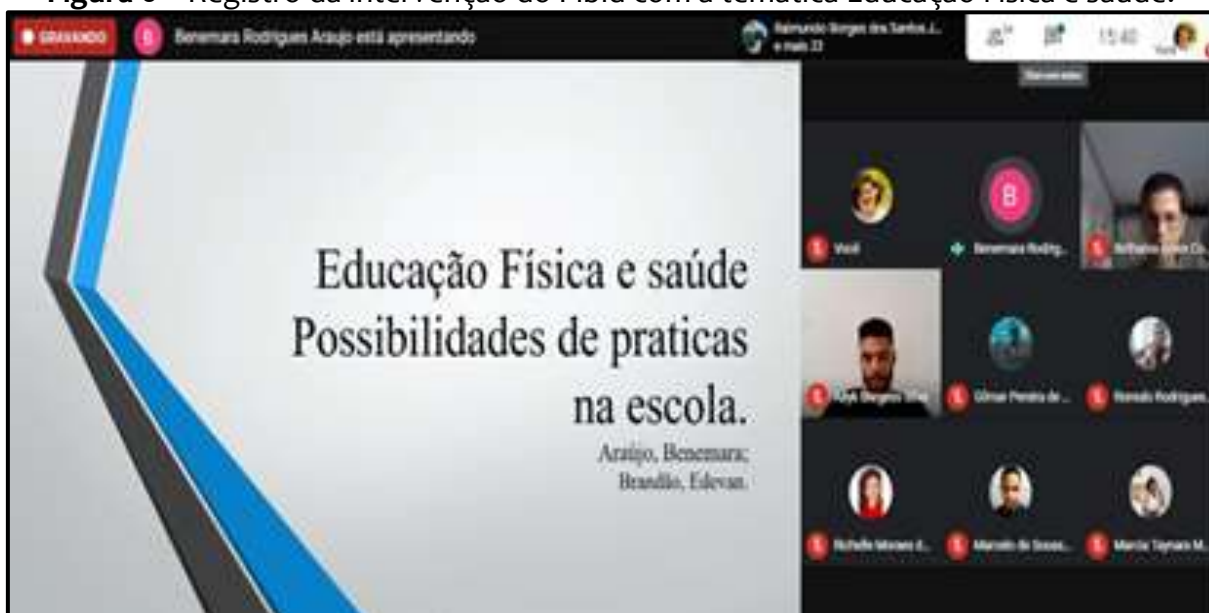
Figura 6 – Registro da intervenção do Pibid com a temática Educação Física e saúde.

A fim de possibilitar maior interação dos alunos com o tema saúde mental, social e corporal, os bolsistas do Pibid/UFT que atuaram com turmas do Ensino Médio produziram materiais de apoio que tematizaram a saúde a partir da prática corporal Ginástica. Essa experiência foi subsidiada pela produção de materiais audiovisuais em formato de slides , vídeos, blog e podcasts , que eram divulgados pela rádio da EF/UFT. Contudo, não temos o retorno do impacto dessas atividades para os alunos das escolas. A Figura 6 registra uma das intervenções remotas do Pibid com alunos do Ensino Médio a partir da temática Educação Física e saúde.