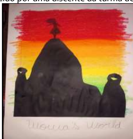
Figura 2 – Desenho inspirado na música Woman’s World , do grupo musical Little Mix, produzido por uma discente da turma de 9º ano.

A música é Woman’s World , de Little Mix. Sempre que eu quero relaxar ou algo do tipo, eu escolho essa música. “Se nunca foi dito como você tem que ser; o que você tem que vestir, como você tem que falar; se você nunca gritou para ser ouvido; você não viveu no mundo de uma mulher; E se você não pode ver que tem que mudar; só querem o corpo e não o cérebro; se você acha que é assim que funciona; você não viveu o mundo de uma mulher, não” (NARRATIVA, discente da turma de 9º ano).