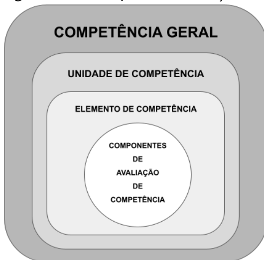
Figura 1 – Modelagem conceitual para estruturação da análise temática.