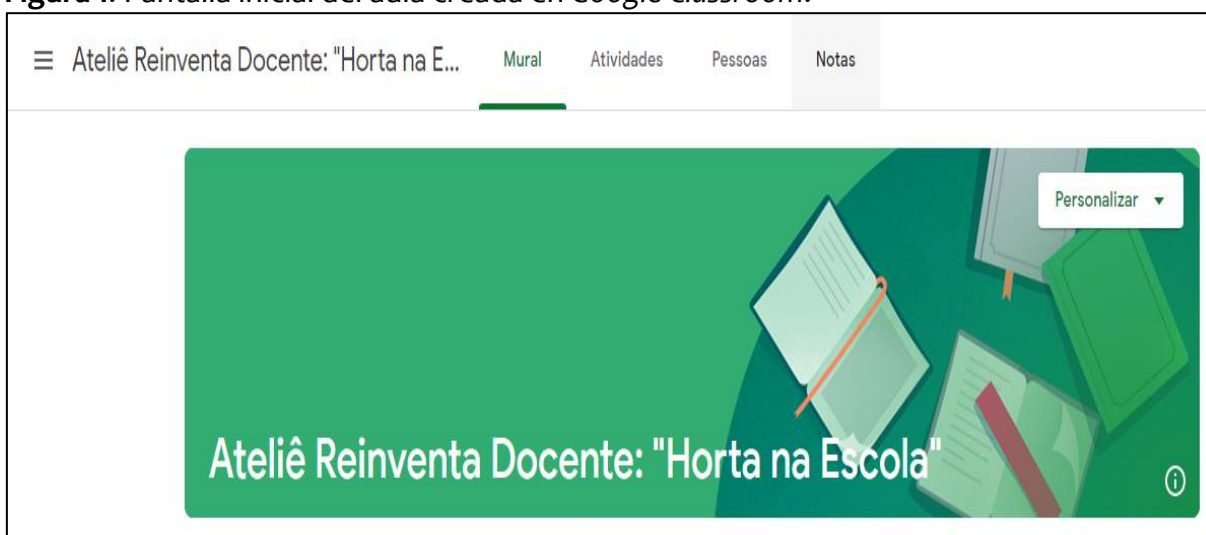
Figura 1: Pantalla inicial del aula creada en Google Classroom .

Los profesores que participaron del proceso de formación provienen de las regiones Nordeste, Sudeste y Sur de Brasil y tienen títulos en diversas carreras, a saber: Ciencias Biológicas (7), Geografía (3), Historia (1), Pedagogía (4), Matemáticas (1), Educación Física (1), Artes (1) y Letras (1), totalizando 19 docentes. Caracterizar un perfil de los docentes que desarrollan sus actividades en los primeros y últimos años de la Enseñanza Primaria, así como en la Enseñanza Media. La formación de un grupo con trayectorias diversas partió de la premisa que implicaba la discusión de una propuesta interdisciplinaria en el campo educativo.