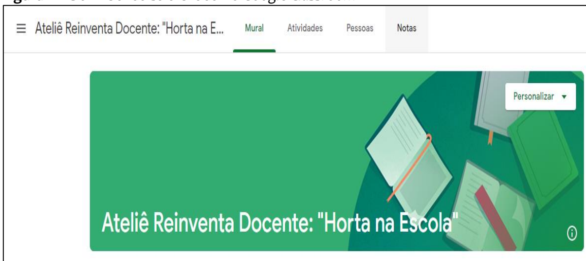
Figura 1: Tela inicial da sala criada no Google Classroom .

Os docentes que participaram do processo formativo são oriundos das regiões Nordeste, Sudeste e Sul do Brasil e possuem licenciatura em cursos diversos, a citar: Ciências Biológicas (7), Geografia (3), História (1), Pedagogia (4), Matemática (1), Educação Física (1), Artes (1) e Letras (1), totalizando 19 professores. Caracterizando um perfil de professores que exercem as suas atividades nos anos iniciais e finais do Ensino Fundamental, bem como no Ensino Médio. A constituição de um grupo com formações diversificadas partiu da premissa que envolveu a discussão de uma proposta interdisciplinar no campo educacional.