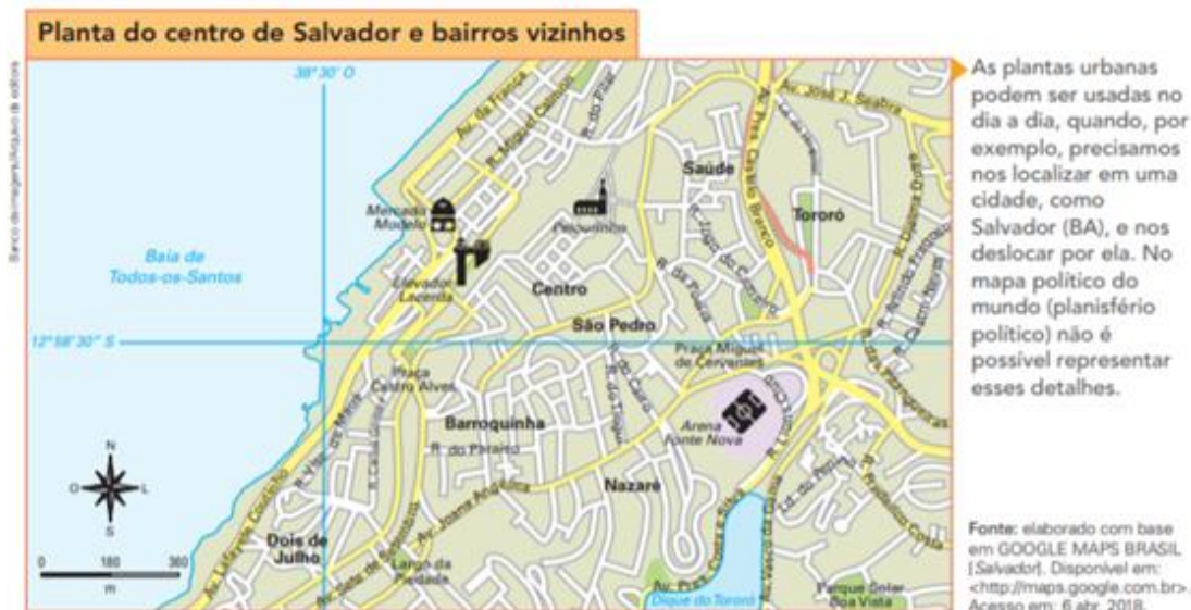
Figura 3 – Planta do centro de Salvador e bairros vizinhos.