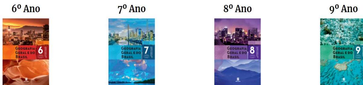
Figura 1: Coleção Geografia Geral e do Brasil, Ensino fundamental anos finais, PNLD 2020.