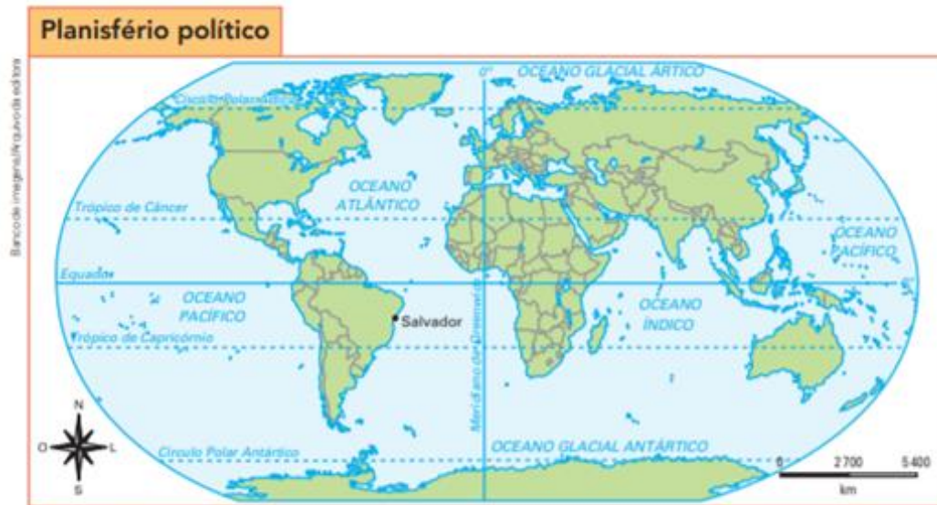
Figura 2 - Planisfério político no livro do 6º ano