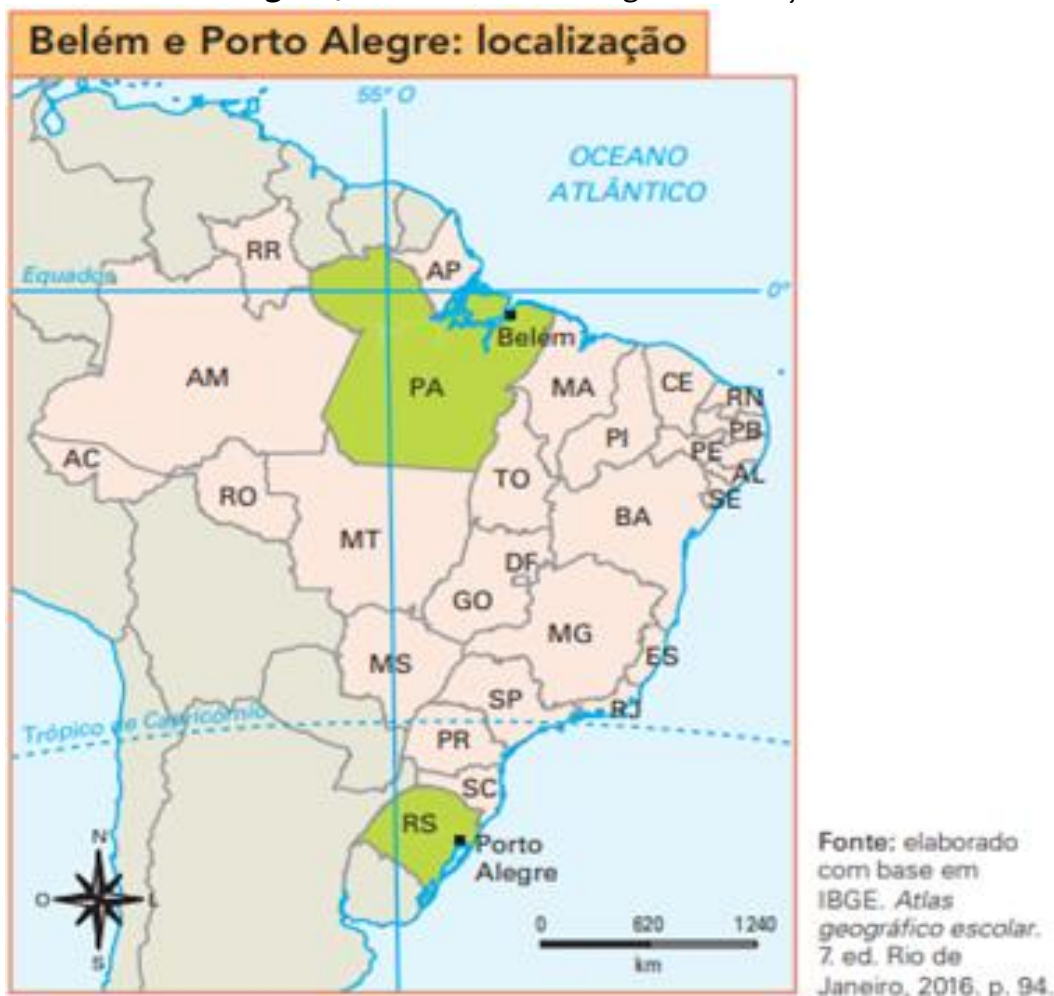
Figura 5 – Belém e Porto Alegre: localização

Na unidade 5, é feita uma tentativa de relacionar duas representações cartográficas, um mapa e um gráfico, como apresentado na Figura 6. No entanto, para que o aluno seja capaz de fazer essa relação, é necessário que ele seja estimulado pelo professor. Em outra parte dessa unidade, o autor utiliza três tipos de representações - um mapa, um perfil topográfico e um gráfico - como apresentado na Figura 7. Nesse ponto, é possível afirmar que o livro didático permite ao estudante fazer correlações e comparações para entender as diferentes temperaturas das cidades, mesmo em latitudes próximas. É importante ressaltar que esse recurso didático não será suficiente para que o aluno alcance novos conhecimentos geográficos, mas é a partir da mediação do professor que isso será possível.