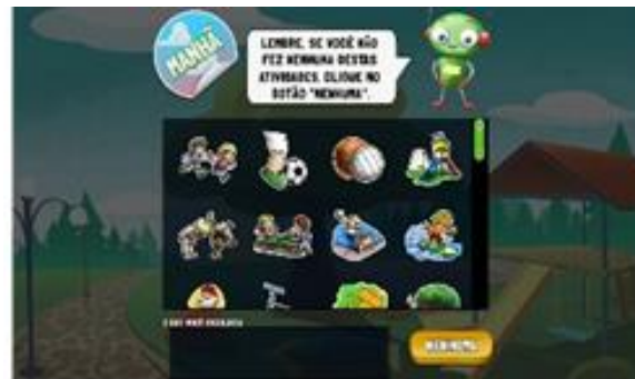
Tela para o relato das atividades físicas e comportamentos sedentários no Web-CAAFE.