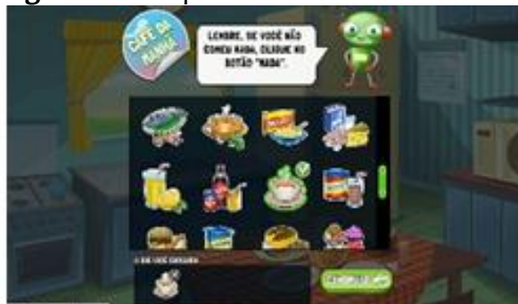
Tela para o relato do consumo alimentar no Web-CAAFE.