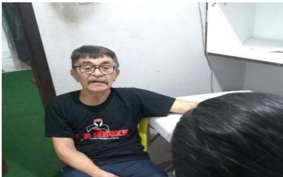
Foto de entrevista realizada nas dependências da academia ajeboxe no dia 28 de maio de 2021.

Após as transcrições das respostas da entrevista, as falas foram sistematizadas e organizadas, tendo como caminho condutor a carreira do entrevistado como boxeador e as implicações para a sua vida. A seguir, apresentamos os resultados, sendo os mesmos expostos, a partir da apresentação das perguntas e respostas, seguidas de análise das mesmas.