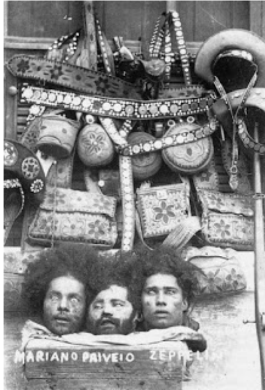
Imagem 2: Cabeças dos cangaceiros e seus pertences

Não é prudente fazer juízo de valor acerca da conduta das volantes, ao menos, não é essa a minha intensão. Cortar a cabeça de uma pessoa após assassiná-la brutalmente é, aos olhos de hoje, um ato que beira a insanidade. Entretanto, é preciso lembrar que aqueles homens eram fruto da dura terra sertaneja, como descrito acima, e que, como filhos do seu tempo, agiam como tal (LIMA, 2006). Um erro muito comum entre as pessoas que gostam de história é fazer julgamentos de pessoas que viveram em outros períodos, tomando como elemento balizador seus valores contemporâneos. Nós, historiadores, damos a esse comportamento o nome de anacronismo histórico.