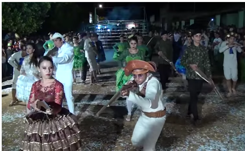
Imagem 8: Quadrilha Junina Arroxa o Nó – Euclides da Cunha-Ba.