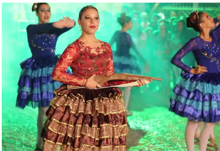
Imagem 7: Quadrilha Junina Arroxa o Nó – Euclides da Cunha - Ba.

Outra Quadrilha Junina da cidade de Euclides da Cunha, fascinada pelo universo do cangaço, montou o espetáculo: Ah Lampião vivo!, com esse trabalho a Quadrilha Junina Arroxa o Nó, sagrou-se campeã no festival de quadrilhas juninas do município, o evento é um concurso que integra as comunidades rurais, de onde advém a maioria dos grupos objetivando promover a cultura local circulando e difundindo os trabalhos cênicos atrelando atividades culturais e pedagógicas, provendo ainda entretenimento, conhecimento e geração de renda.