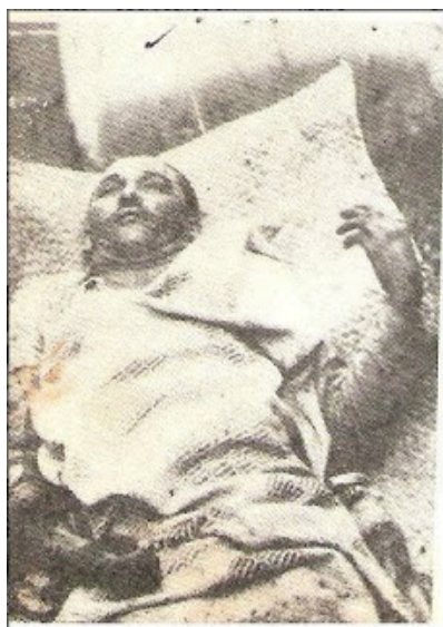
Imagem 12: Corisco agonizando