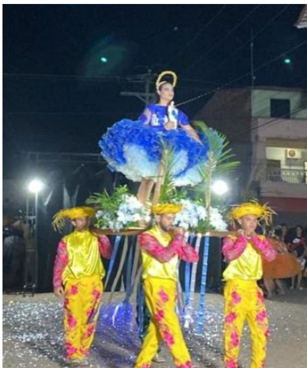
Imagem 5: Representação de Nossa Senhora da Conceição, destaque da Quadrilha Junina Raízes do Sertão – Euclides da Cunha-Ba.