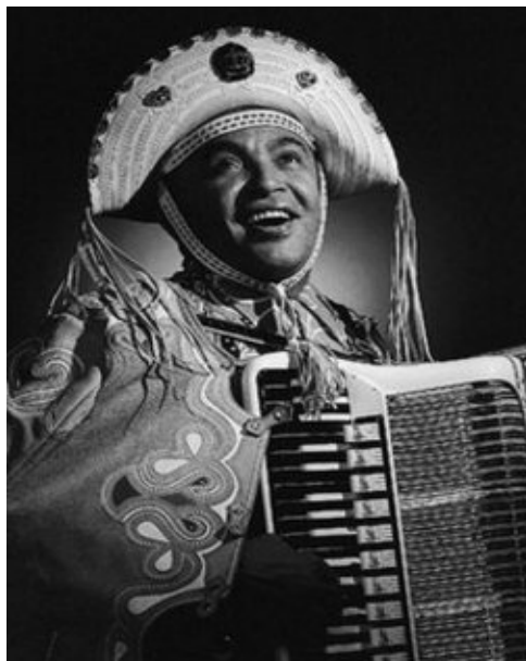
Imagem 1: Luiz Gonzaga.

Toda essa interface da vestimenta, com a cultura e os elementos de arte foi melhor difundido com a produção da sétima arte inicialmente em preto e branco e depois com as imagens coloridas, conseqüentemente vários artistas adotavam um ou outro elemento do universo do cangaço para a sua criação artística seja na música como foi o caso do “Rei do Baião”, Luiz Gonzaga.