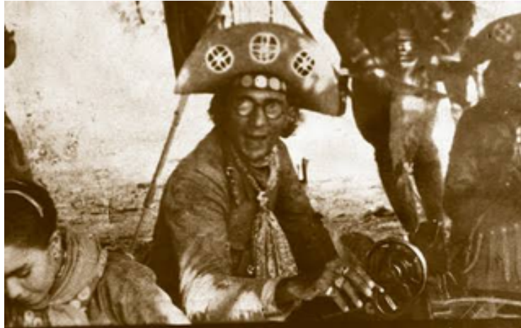
Imagem 2: Lampião na máquina Singer.

O modismo influenciou o cangaço, Lampião, como chefe se diferenciava, usando camisas listradas ou estampadas, com botões de ouro, tudo era enfeitado, ganhando assim um toque artístico pelo artesanato, as cartucheiras, as bainhas dos punhais, as alças dos fuzis completavam a riqueza dos trajes. Se até os cães dos cangaceiros ostentavam no estilo da moda, quanto mais as mulheres que carregavam a beleza natural de sua juvenildade: