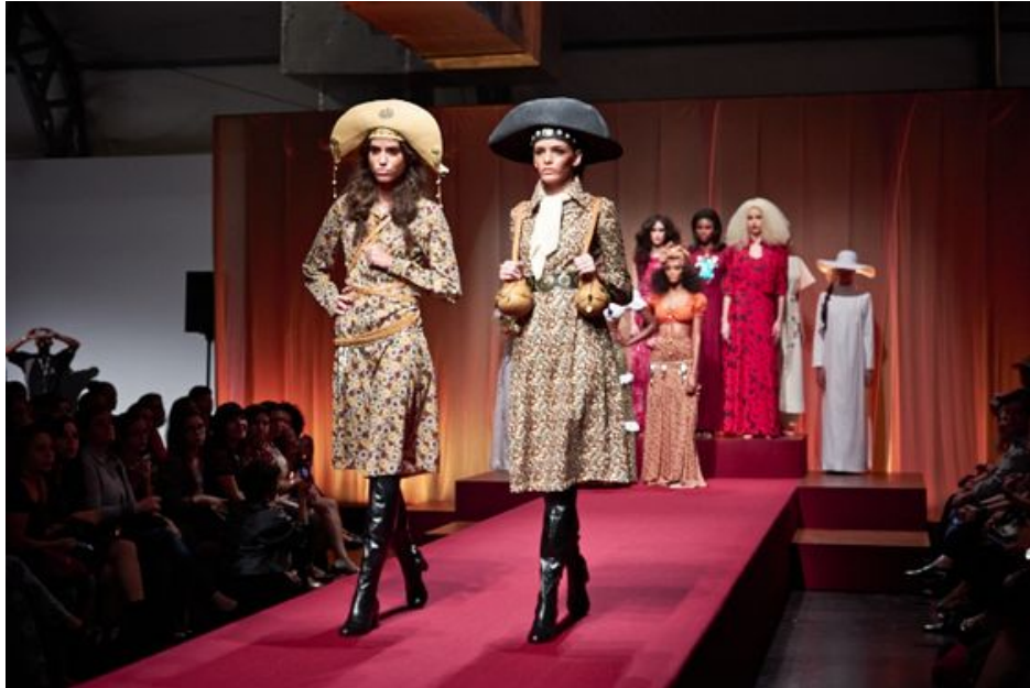
Imagem 3: Look da coleção Maria Bonita.

É inegável que o cangaço serve até hoje como fonte de inspiração para as diversas produções artísticas, Marcelo Dídimo escreveu o livro “O cangaço no cinema brasileiro” que exhibe uma variedade de filmes com comentários relevantes, evidenciando a importância do cinema e do cangaço enquanto fruto de inspiração e releitura, baseada em uma ampla pesquisa.