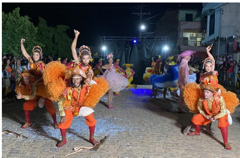
Imagem 6: Quadrilha Junina Raízes do Sertão – Euclides da Cunha-Ba.