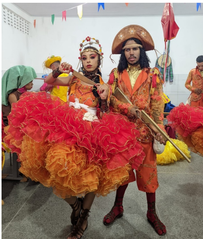
Imagem 4: Casal destaque da Quadrilha Junina Raízes do Sertão – Euclides da Cunha-Ba.