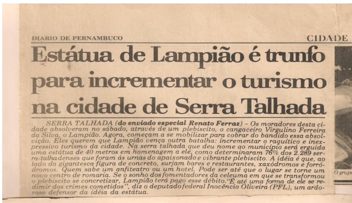
Figura 3: Manchete sobre o resultado do plebiscito em Serra Talhada.

Dois dias depois, em 09 de setembro de 1991, o ocorrido em Serra Talhada é noticiado nacional e mundialmente, exteriorizando o querer dos que defendiam ser Lampião o produto turístico capaz de promover visibilidade à cidade e, conseqüentemente lhe promover benesses financeiras. Veja-se o dito em Diário de Pernambuco, um dos dois maiores jornais de circulação no Estado: