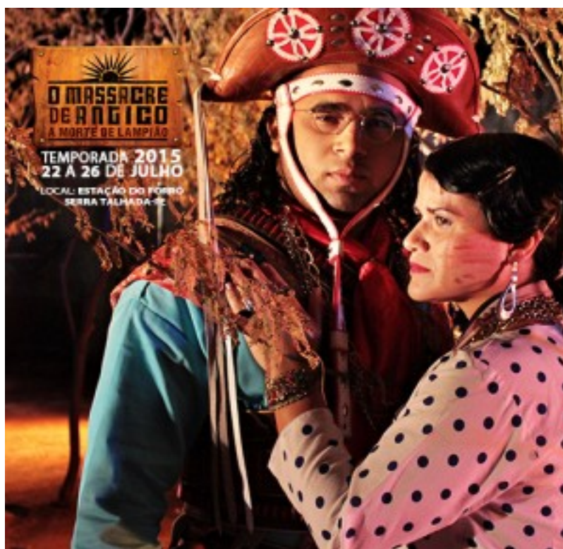
Figura 7: Cartaz de anúncio de peça teatral.