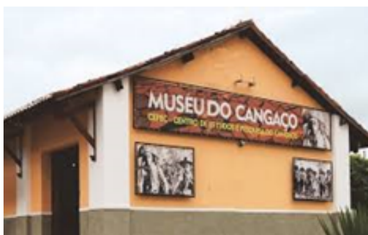
Figura 6: Museu do Cangaço, em Serra Talhada – PE.