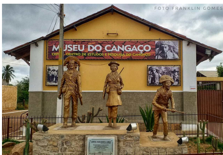
Figura 8: Museu do Cangaço em Serra Talhada

No ano de 2019, estátuas de Lampião, Maria Bonita e Zabelê (cangaceiro serratalhadense) foram colocadas na entrada do museu, conforme se visualiza abaixo: