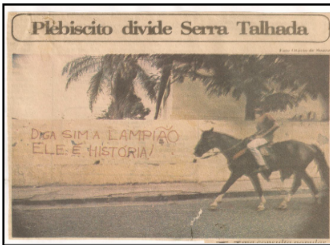
Figura 1: Muro de escola serratalhadense pichado pelo sim a Lampião. Fonte: Diário de Pernambuco, 21 de julho de 1991.

Lampião visto somente como História foi um agir intencional dos produtores culturais que o queriam ressignificado. Significava pô-lo numa posição assemelhada a outros personagens históricos e escamotear as suas ações, principalmente as negativas, como elemento usado para caracterizá-lo. Esse discurso dos produtores culturais se materializou em carta aberta à população serratalhadense, que se espalhou pela cidade, não tendo autoria definida (hoje dito por Domá ter sido autoria sua) e intitulada: “Nem herói, nem bandido, ele é História: diga sim a Lampião” (FERREIRA JÚNIOR, 2021). Abaixo a reverberação do defendido na carta citada, pichado em muro de escola serratalhadense, quando da campanha pelo sim à estátua para Lampião.