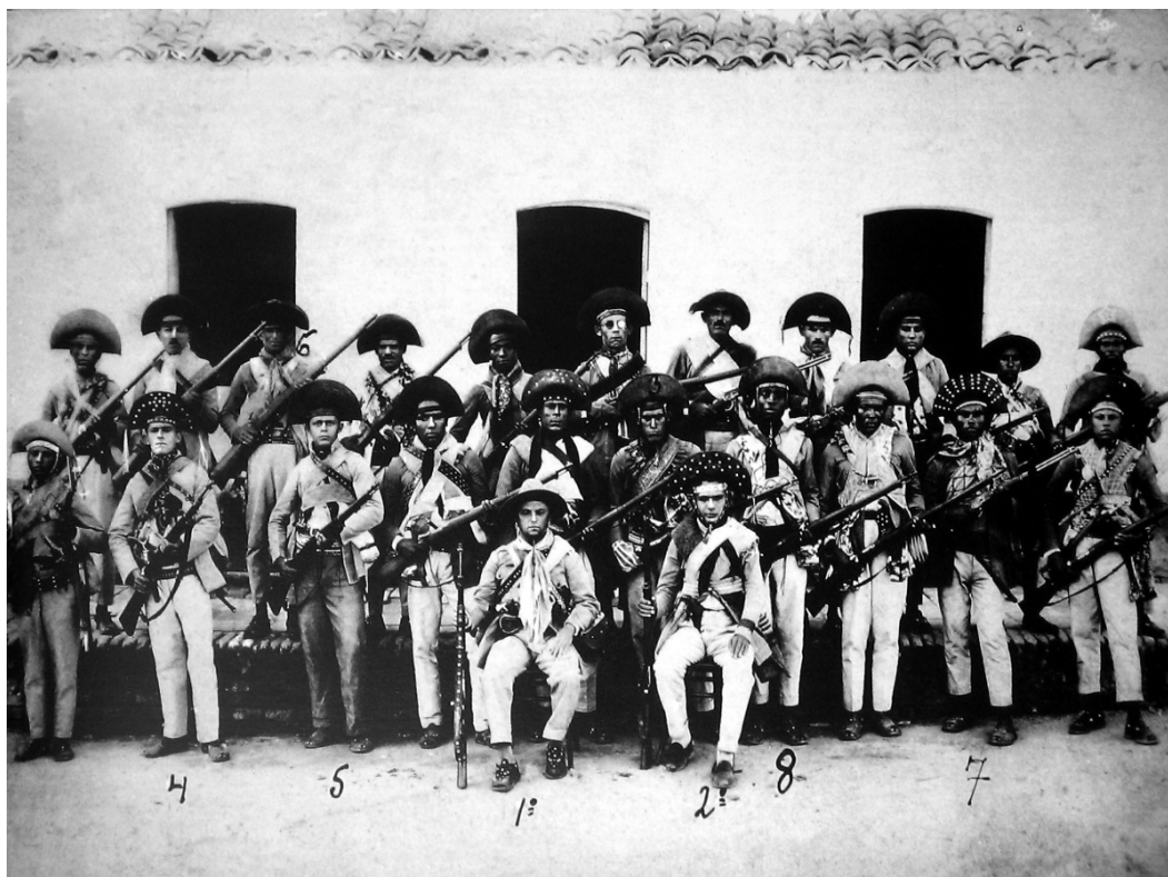
Imagem 1 – Bando de Lampião.

A forma como o Estado brasileiro conduziu o combate à seca no início do século XX, segundo Durval Muniz de Albuquerque Júnior (2006), contribuiu para cunhar o termo Nordeste, já que o termo foi usado para designar o espaço de atuação da Inspetoria Federal de Obras Contra as Secas (IFOCS). Para Clemente (2013), a criação de tantos organismos de enfrentamento das secas acabou constituindo uma identidade regional para o Nordeste, logo, cunhou também as características que definiriam os cangaceiros.