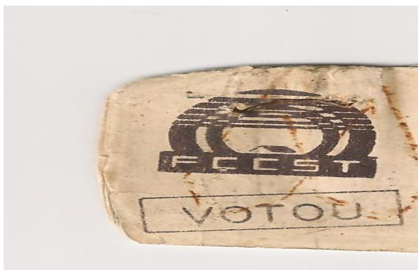
Figura 2: Comprovante de votação no Plebiscito de 1991.

Em sete de setembro de 1991, ocorre a votação. Contrariando as expectativas ruins – porquanto havia ameaça de invasão da cidade, por parte de homens habitantes na vila de Nazaré, descendentes de nazarenos membros de volantes e perseguidores de Lampião -, a votação ocorreu normalmente. Compareceram aos postos de votação 2289 pessoas, das quais, 1648 disseram SIM à construção e implantação em Praça da cidade, de uma estátua de Lampião (FERREIRA JÚNIOR, 2021). Abaixo, um comprovante de votação.