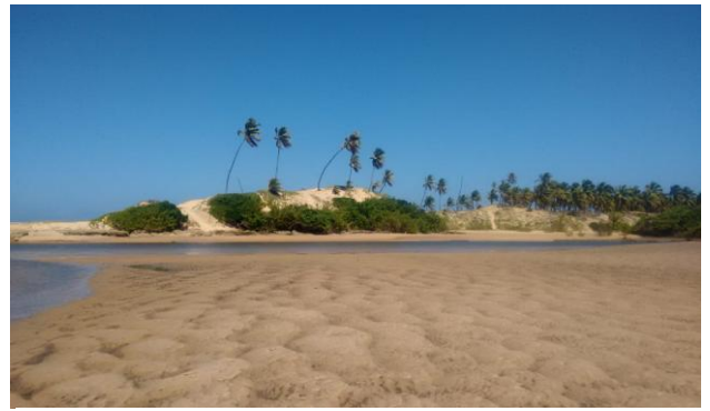
Figura 2: Barra do Itariri.