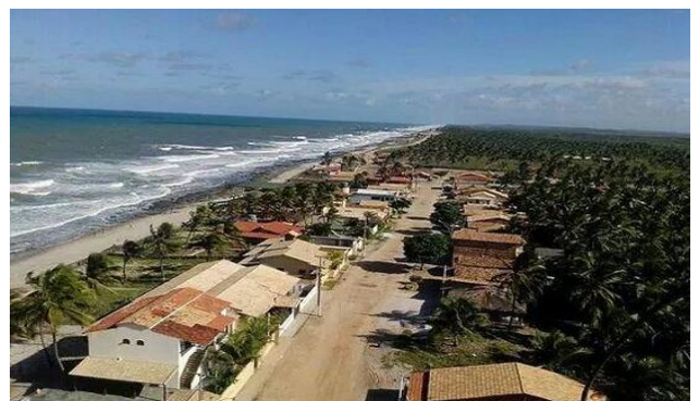
Figura 6: Barra do Itariri.