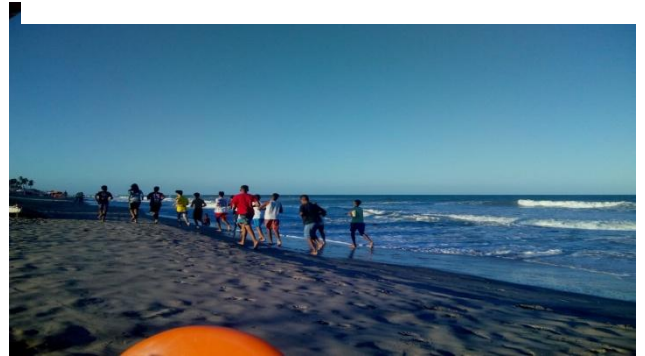
Figura 4: Sítio do Conde.