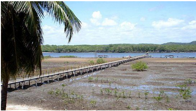
Figura 1: Barra da Siribinha.