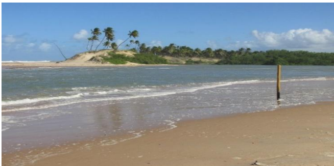
Figura 7: Poças, Conde- BA.