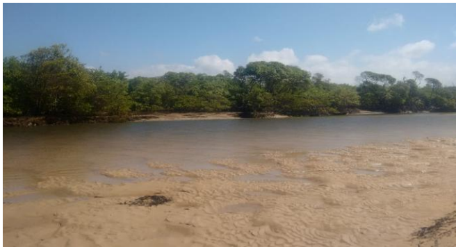
Figura 3: Barra do Itariri.