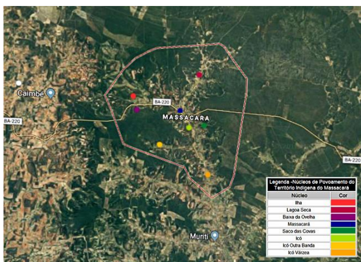
Mapa 3 – Distribuição dos núcleos de povoamento Kaimbé no Território Indígena do Massacará, 2018.