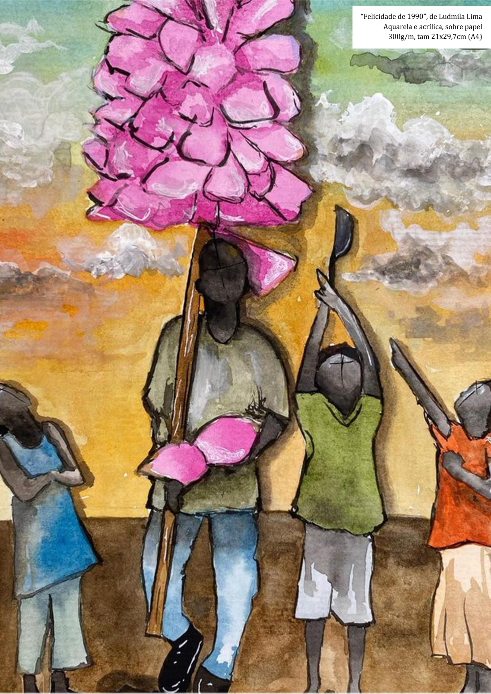
“Felicidade de 1990”, de Ludmila Lima Aquarela e acrílica, sobre papel 300g/m, tam 21x29,7cm (A4)