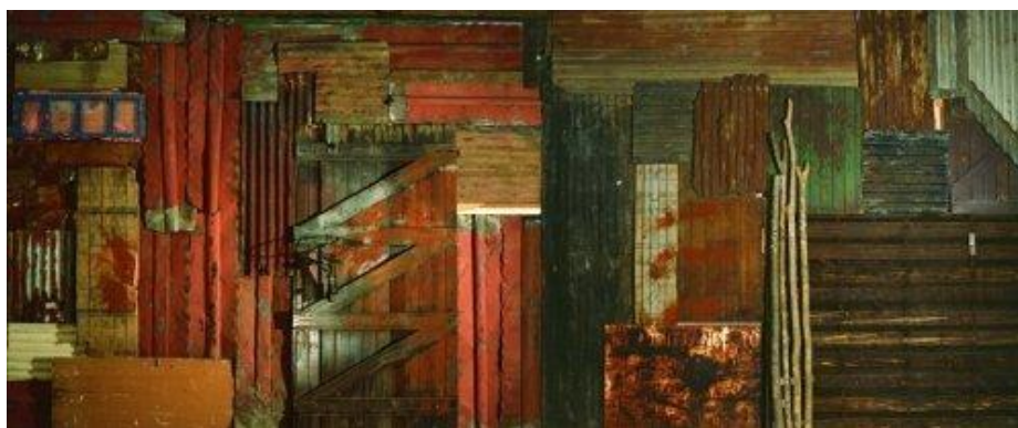
Figura 6 – Fragmento da instalação Margem da Zona Limite. Joanesburgo (1995). 400 x 1200 cm.