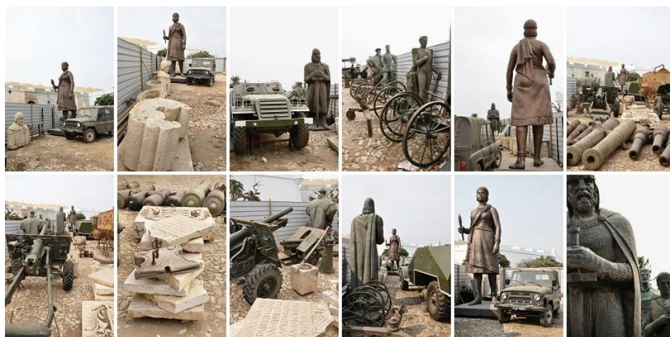
Figura 9 – Kiluanji Kia Henda, Balumuka – Ambush (2010).

Em “Balumuka – Ambush” (2010), que compõe parte dos trabalhos de “Homem Novo” (figura 9), Henda se aproveita de um cenário composto pela deposição desses vários objetos. As fotografias de placas desmontadas, bustos depositados no chão, estátuas desentronizadas, projéteis de canhões e viaturas - feitas na altura em que se realizava o inventário museográfico – formam um cenário bélico que parece estar abandonado e encarcerado entre placas de alumínio. O título da série de doze fotografias já indicia o sentido da narrativa criada pelas imagens: “balumuka” é um vocábulo da língua kimbundo que significa “erguer-se, levantar-se”; ao justapor o termo a um vocábulo da língua inglesa ( ambush ) que pode ser traduzido como “cilada, emboscada”, o artista insere seu trabalho numa revisão pós-colonial do passado, em que o presente atua ainda como tempo de erguer-se da emboscada colonial.