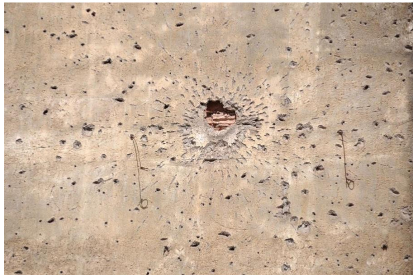
Figura 7 – Kiluanji Kia Henda. Big Bang (Huambo), 2009. 86,5 x 130 cm x 130 cm.

perfurações ao redor, como uma onda explosiva a percorrer a parede. Em “Balas e satélites” (figura 8), observa-se uma parede com sinais que indicam a presença humana, a julgar pelas antenas instaladas, que, por sua vez, suscitam a imagem de canhões apontados para o alto. Junto com as antenas, as marcas de bala e as grades sobre grades, o quadro sugere clausura, violência e transição de um passado com chuvas de balas para um presente em que a tecnologia se inscreve sobre rastros de projéteis. Corpos ausentes de vítimas assassinadas dão lugar a novos sujeitos, alguns deles sobreviventes, que convivem com e entre as ruínas.