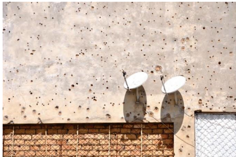
Figura 8 – Kiluanji Kia Henda. Balas e Satélites (Huambo), 2009. 86,5 x 130 cm.