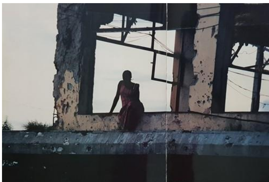
Figura 2 – Habitante de Luanda entre as ruínas de um prédio marcado com balas.