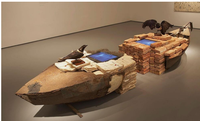
Figura 5 – Fragmento da instalação Margem da Zona Limite . Joanesburgo (1995). Fonte: António Ole.

Um exemplo é a instalação “Margem da Zona Limite”, cuja montagem inicial data de 1994; e, de 1995, a exposição na Primeira Bienal de Joanesburgo . Nela, o artista (re)contextualiza e acumula diversos objetos encontrados ( objet trouvé ) em viagens prospectivas que fez pelo país e pelos musseques de Luanda. Uma das partes dessa obra constitui-se da estrutura (feita de ferro) de uma embarcação, seccionada em duas partes (Figura 5): de um lado, uma pilha de tijolos de barro e um corvo embalsamado, com asas e bico abertos, mira a imagem de um mar em um televisor; de outro, uma pilha de papéis, pastas de arquivos e mais um corvo com asas fechadas, também a mirar a imagem do mar em outro televisor.