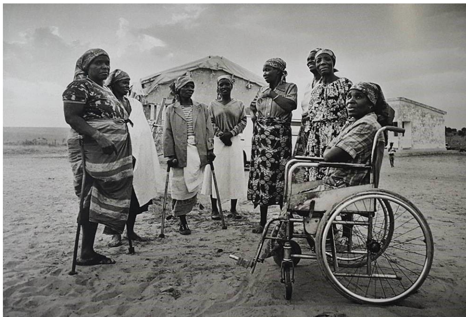
Figura 1 – Vítimas de minas terrestres em Huambo, Angola, 1997. Fonte: Sebastião Salgado, 2007.

da identidade nacional. Juntamente com manifestações literárias acerca do período de guerra, situam-se instalações, fotografias e performances de artistas que se vinculam à memória do passado colonial e de guerras. É o caso das obras de dois fotógrafos brasileiros: África (2007), de Sebastião Salgado – em que se expõe uma série de fotografias cuja temática são as marcas da guerra impressas em corpos de crianças, jovens e de senhoras (Figura 1); e Duas ou três coisas que eu vi em Angola (2000), de Sérgio Guerra – que representa, dentre outros, espaços-imagens de moradores angolanos habitando ruínas de prédios marcados por guerras (Figura 2).