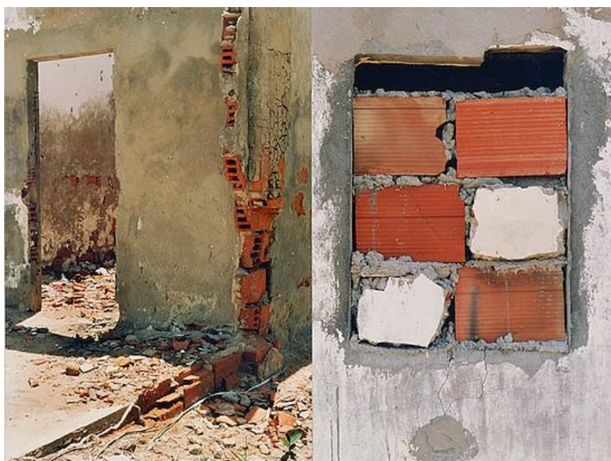
Figura 3 – Sem título (I). Impressão fotográfica. 90 x 120 cm. 1998. Fonte: António Ole. 3

trados. À direita, uma mulher, cujo rosto não se consegue ver, está curvada sobre uma bacia, próxima a outras três.