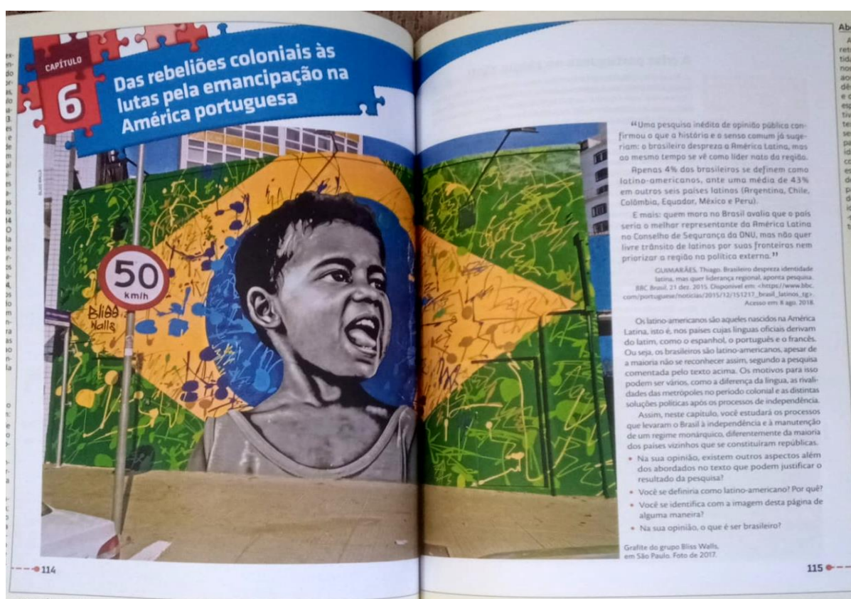
Imagem 1 - Imagem de introdução do capítulo 6 do livro didático da Editora Moderna.

Após a análise dos dois livros, é possível concluir que o livro didático da Construir faz uma abordagem mais tradicional do que o livro da Moderna. Corroboramos este aspecto ao analisarmos duas imagens, a primeira a que introduz o capítulo 6 da editora Moderna e a segunda introduz a unidade 2 da editora Construir.