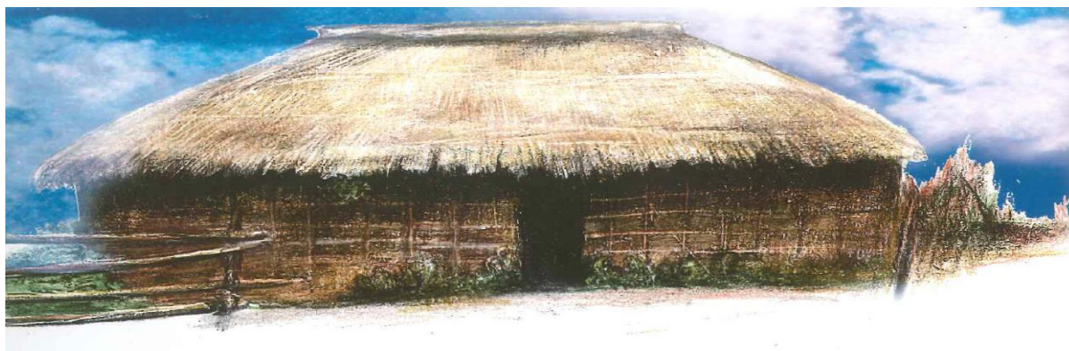
Figura 1 - A aldeia

O conteúdo precípua de “Meu vô Apolinário: um mergulho no rio da (minha) memória” remete ao que se passa no ambiente escolar e, “a partir do encontro com o texto, o leitor poderá ampliar o seu poder de argumentação a respeito de assuntos antes desconhecidos, como ocorre em relação à prática do que chamamos bullying atualmente, fenômeno vivenciado por muitos, mas ainda [...] discutido entre poucos” (MEDEIROS, 2015, p. 35003, grifo da autora). Apesar de não ter nascido na aldeia, é lá que o personagem vive seus momentos de lazer, aprendizado, fortalecimento pessoal, relação com as suas origens, acolhimento, esperança, respeito, amor e bem-viver - em especial pelo contato com o avô - no advento de suas férias escolares.