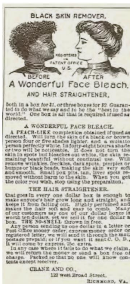
Figura 1. Propaganda do produto Black Skin Remover

A despigmentação não é só uma escolha estética. Existe um emaranhado de questões hegemônicas, políticas e culturais que aprisiona subjetivamente os corpos negros. Segundo Frantz Fanon (2008), essa opressão acarreta uma não aceitação da sua cor e autoimagem, o anseio pela brancura . Conseqüentemente, pactuando com a ideologia do branqueamento. Na tentativa de utilizar as “máscaras brancas”, as pessoas não brancas negam-se a si mesmas, esforçando-se para se distanciar das características tão negativas associadas à sua pele, na sociedade ocidental, promovida pelo racismo.