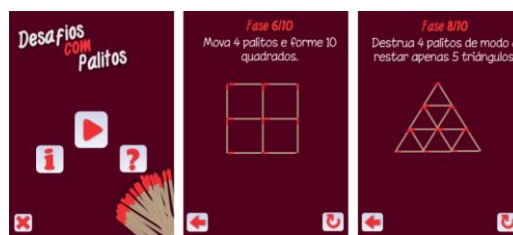
Figura 4. Desafios com Palitos.

A quarta etapa deste trabalho, trata-se da avaliação de interface e da avaliação pedagógica dos jogos desenvolvidos. Esta avaliação preocupa-se não somente com os aspectos computacionais de interface, mas também com os aspectos pedagógicos, isto em função de se tratar de um software desenvolvido para educação, e que necessita de ambos os aspectos.