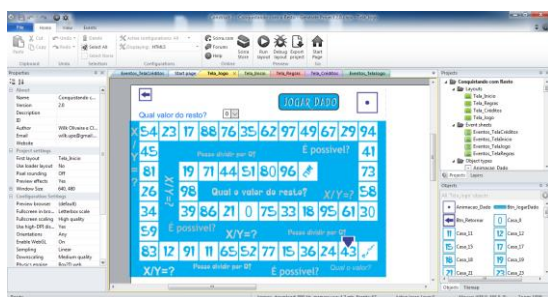
Figura 3. Tela Jogo em processo de desenvolvimento.